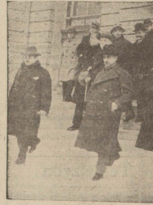
Başbakan General İsmet İnönü ve İç işleri Bakanı Bay Şükrü Kaya Haydarpaşa garında kendilerini karşılayanlar arasında

İSTANBUL, 1 (A. A.) — C. H. F. umumi reislik divanı yeni sayılabilecek namzetleri hakkında istişare için fırka idare heyetlerinin 2 şubat 1935 cumartesi günü saat 11 de toplanmasına karar vermiştir. Fırkanın Meclis Grubu idare heyetini 2 şubatta Dolmabahçe'de toplanmaya davet ederim. 1 - 2 - 935 İsmet İNÖNÜ