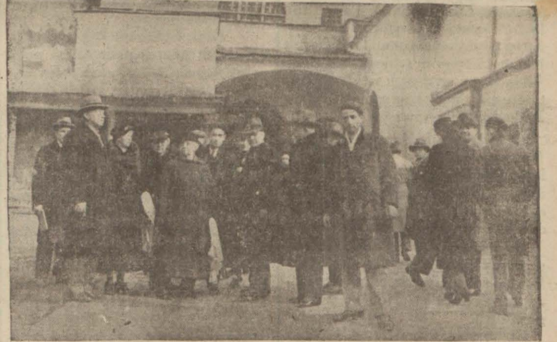
'Ayasofyayı ziyarete gelen seyyahlar. Bir kaç zamandan beri müzeye çevirmek için içinde tertibat alan nan Ayasofya camiiinde bu işler bitirilmiş ve müze dün açılmıştır. Camideki halılar ve duvarlardaki (Devamı 7 inci sahifede)