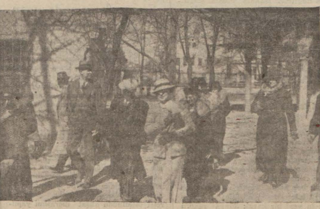
Şehrimizi ziyarete gelen İngiliz seyyahlar Ayasofya müzesinde

Bu arada İngiliz nazîminin sayahatini Varşova ve Moskova'ya teşmil etmesi tekîfi Londrada tevaccüle karışılmakla beraber bu hususta henüz kat'i bir karar verilmemiştir. Böyle bir seyahat, mart ayının iki haftasını ısgal edecektir. Bu kadar uzun bir seyahat, bilhassa parlamentonun mühim içtimalar akdettiği bir zamanda