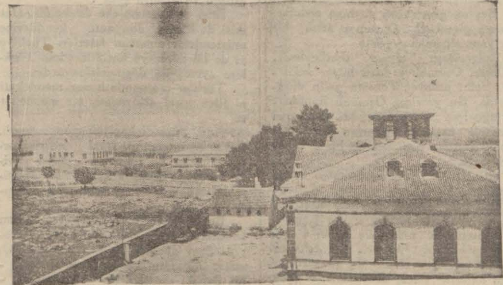
Diyarbekir hastahane binası

DIYARBEKİR, (Milliyet) — Evvelce vilâyetimizde sağlık kurumumuz yoktu. Bugün ise Diyarbekirde sağlık kurumumuz kurulmuştur. Bu kurumun inşaatı için Diyarbekirde sağlık kurumumuz kurulmuştur. Bu kurumun inşaatı için Diyarbekirde sağlık kurumumuz kurulmuştur.