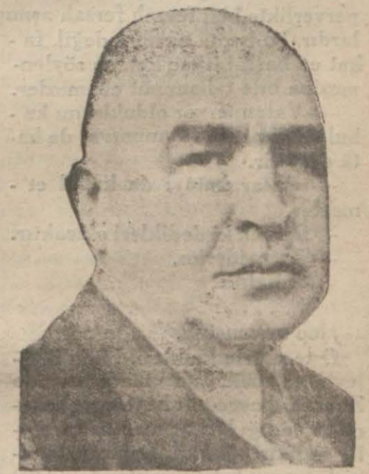
Bayındırlık Bakanı Bay Ali Çetinko

ANKARA, 23 (Telefonla) — Ereğli limanı ile Ereğli - Filyos elektrikli demiryolunu inşa talip Vickers İngiliz şirketi ile Bayındırlık Bakanlığının müzakerecileri görüşüyor. Şirket müessesileri Londradan kat'i tekliflerini hazırlayarak bu işlerle alakadar Bayındırlık, Sıhhiye ve Okonomi bakanlıklarına yollayacaklardır. Öğrendiğimize göre şirket bu işleri çok müsait şartlarla yapmak kararını hükümetimize bildirmiştir. Bu cümleden olmak üzere Okonomi Bakanlığının Zonguldakta tesisi tasavvurunda bulunduğu büyük elektrik santralini de aynı şirket inşa etmeğe talip olmuştur.