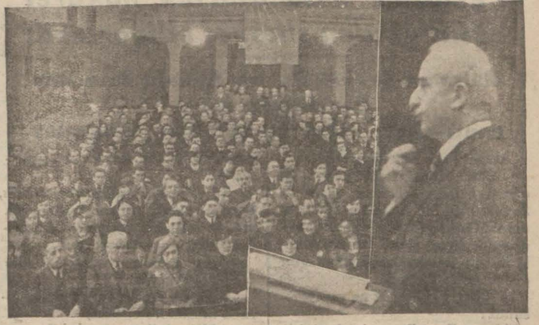
Başbakan İsmet İnönü Ankara Halkevinde söylevini veriyor

MARMARIS, 23. A.A. — Reiscumhur Atatürk Ege vapuruna saat 19 da limanımıza geldiler. Marmaris şimdiye kadar görülmeyen bir sevinç ve şenlik içindedir. FETHİYE, 22.A.A. — (Bu sabah alınmıştır) : — Dün 21-2-935 akşam saat 13 de Ege vapuru ile Mersinden yola çıkan Reiscumhurumuz Atatürk bu akşam saat 20.30 da limanımıza geldiler. Halk sevinç içindedir. Atatürk'ün geceyi limanımızda geçirmesi unutulmaktadır.