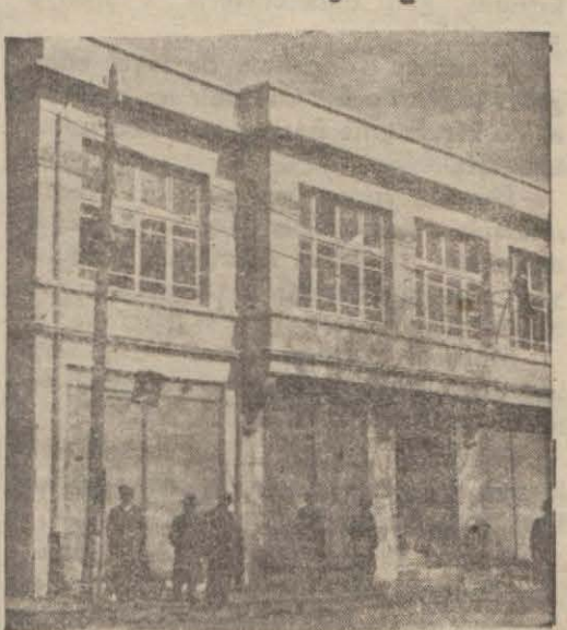
Akşehir bankasının merkezi