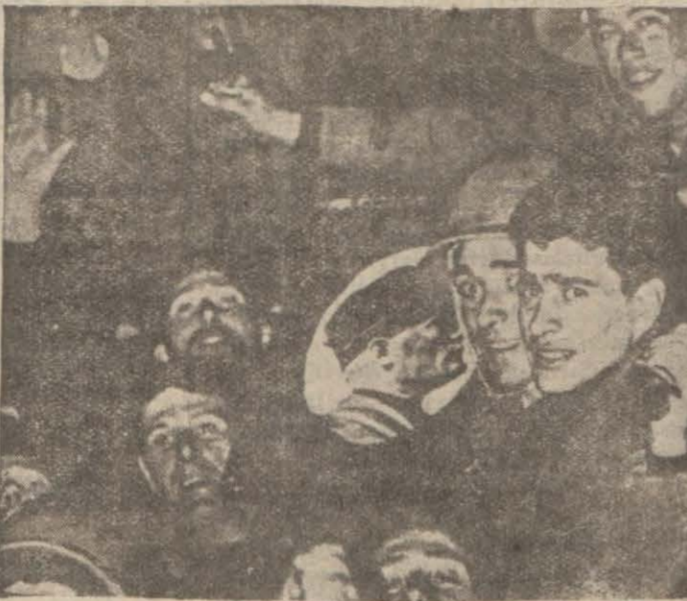
Habeşistana giden İtalyan askerleri

ROMA, 23 (A.A.) — Reuter Ajansı muhabirinden: Dün akşam Napoliden 2,000, Cenovadan 1300, İtalyan askeri, İtalyanın Şarkı Afrika'daki müstemlekelerine gönderilmek üzere, vapura bindirilmeye başlandı. Mesina'da 2000 kişi bugün, 3000 kişi de pazar günü vapura binmeğe hazır. Vulcanio vapuru dün akşam, 400 mü tehasüs amele ile istihkâm ve sıhhiyeye mensup 700 asker yüklenmiş. Napoliden hareket etmiştir. Bu vapur, aynı zamanda Mesinadan da 1000 asker yükliyecektir. Sefero çıkan kıtaat kumandanı ve İtalyanın en genç generali olan General Graziani de Vulcanio vapuruna binecektir.