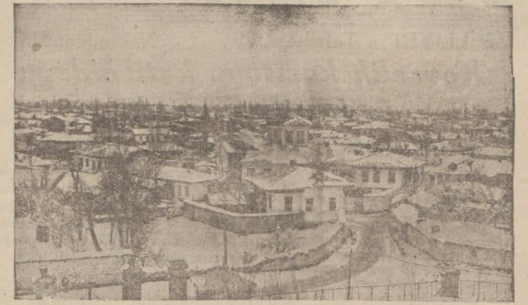
Denizlinin kar altında bir görünüşü

Knoll A.O., kimyevi maddeler fabrikaları, Ludwigshafen 1/Rhin.