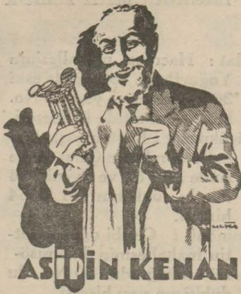
Halis ve hakiki tabletleri sıhhatinizi soğuktan ve bütün ağrılardan korur.

d) Mektebe kabul olunduğu takdirde Askeri kanunlar, nizamlar ve talimatları tamamen ve aynen kabul ettiğini natk velisinin ve kendisinin