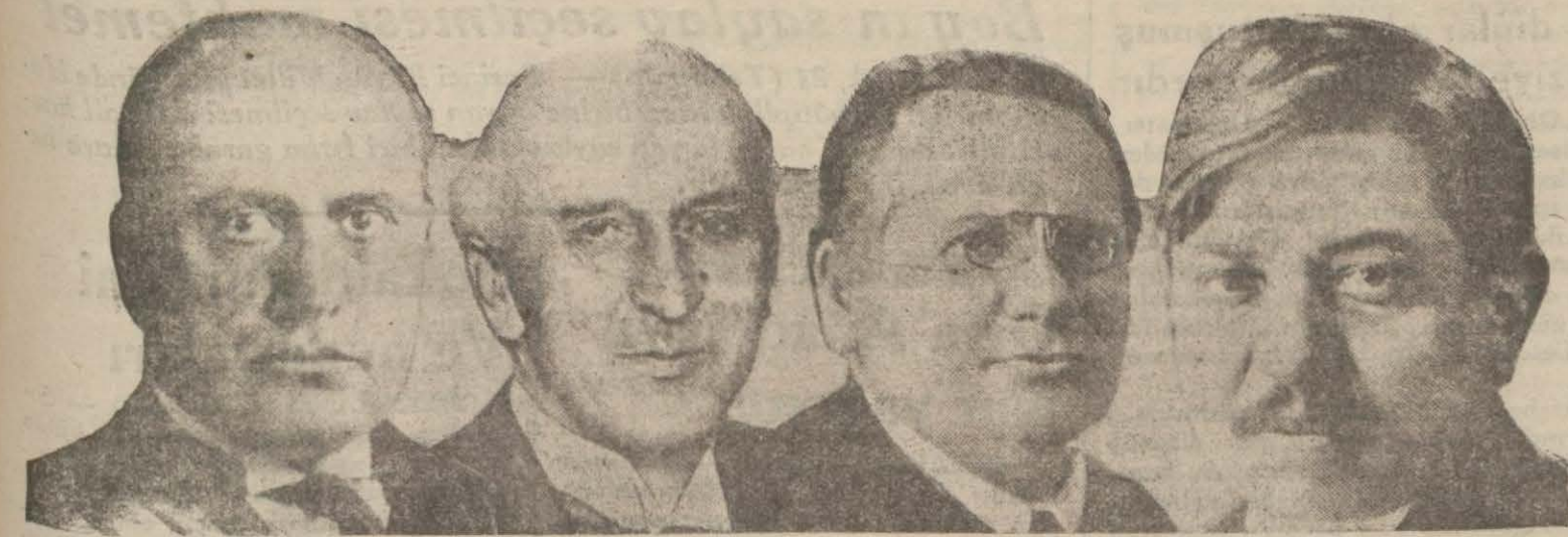
Bay Mussolini, Bay Con Simon, Bay Litvinof, Bay Laval

Con Saymen haftaya Parise gidecektir. Berlinle beraber Varsova ve Moskova'yı da ziyaret etmesi muhtemel