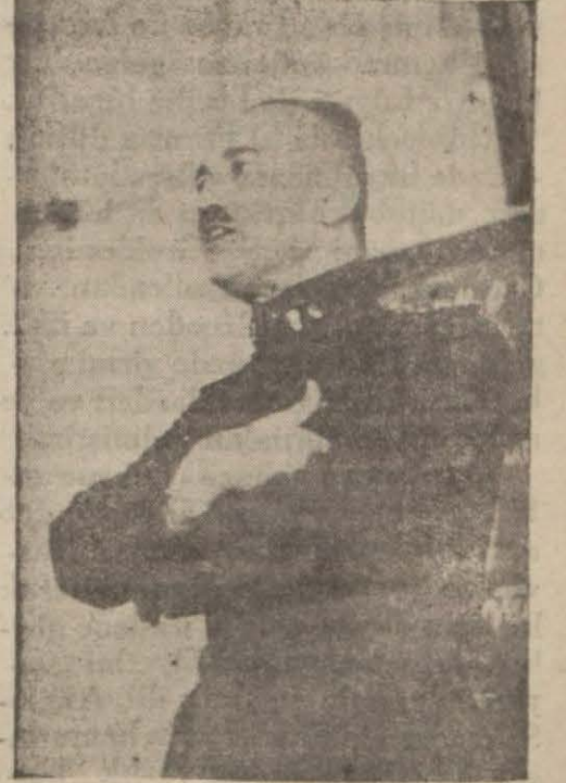
General Mazlûm zabta memurları asayiş muhafaza eder. Şehirde zabta rabtın bozulmaması için (Devamı 6 ncı sahifede)

Bir yere gaz hücumu yapıldığı zaman halk derhal işini gücünü, malını mülkünü bırakarak evvelce hazırlanmış olan mahzenlere, sığınaklara koşacaktır. Canını kurtarmak için başını sokacak bir delik aramak bahanesiyle malının başından ayrılan halkın malını korumak lazımdır. Bu iş polisin, jandarmamın, muhafaza takımlarının işidir. Gazlar zamanında maskeli olan