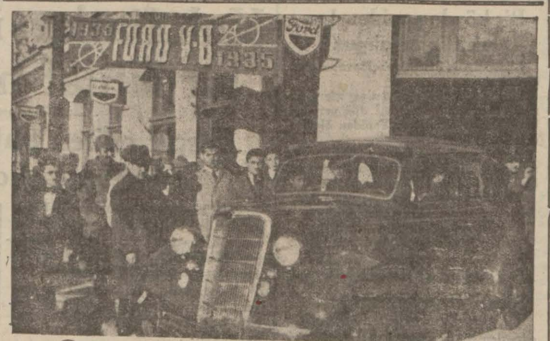
Dün saat 15 te Taksimde Ford bayii Otomotör Ticaret T. A. şirketi salonunda Ford fabrikasının (V. 8 Ford 1935) modelleri teşhir edilmiştir. Bir çok otomobil meraklıları yeni modelleri görmüşlerdir.

Şehir meclisinin dünkü toplantısında bir görünüşü 154 bin lirası imar planı tanzimi masrafına, 100 bin lirası yeni inşa olunacak gaz depolarına, 70 bin lirası yeni tesis olunacak asri mezarlıklara, 50 bin lirası da Haydarpaşada tren hattı altında yapılacak geçit köprüsü inşaatına sarfedilecektir.