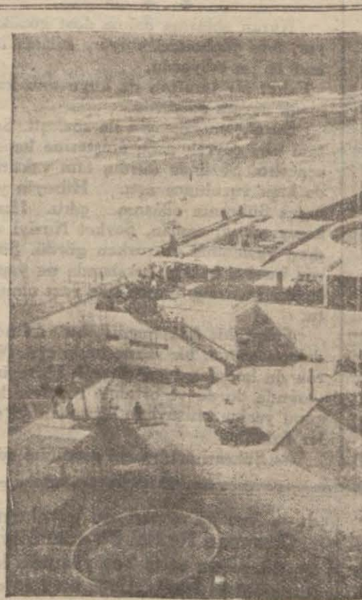
Telaviv sergi sinin gazinosu