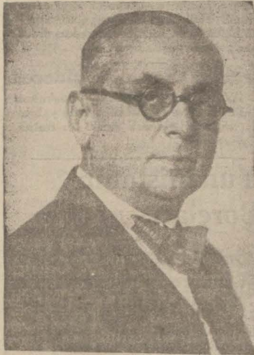
Bay Celâl Bayar

Bizim değiştirmeyeceğimiz politikamız: (malımızı alanın malını almaktır.) Bunun tatbik ve temin olmak üzere uluslararası