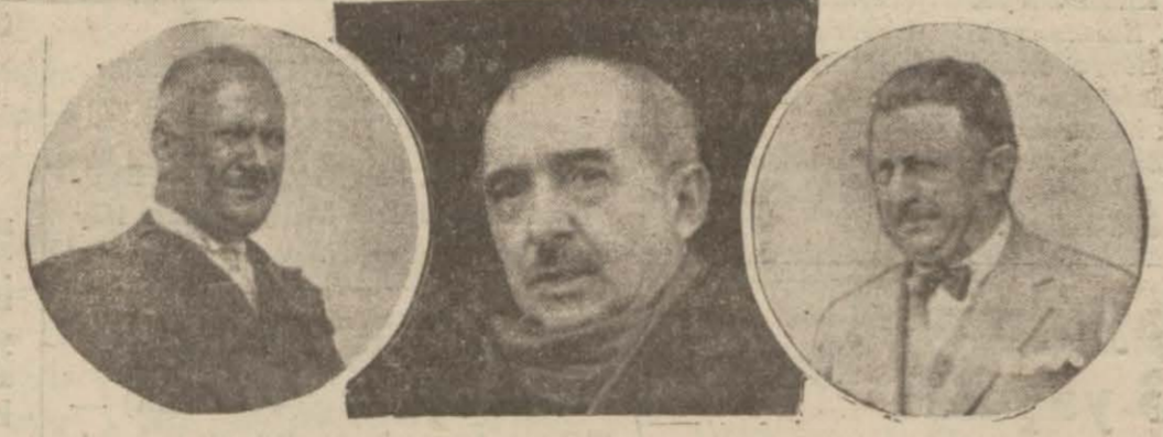
B. Recep Peker, Başbakan İsmet İnönü, B. Şükrü Kaya

Başbakan İnönü, Fırka genel kâtibi B. Peker ve iç işler bakanı geliyorlar