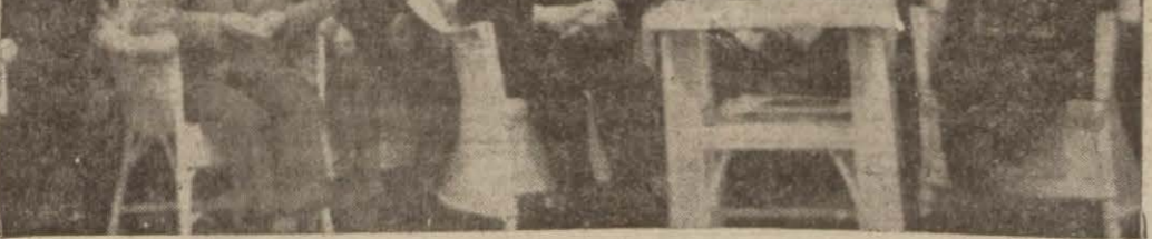
Seyyah tercümanlarına dün belediyede son ders verildi.

LONDRA, 31 (A.A.) — Fransız başbakanı ile dış bakanının Londrada yapılacak konuşmalar hakkında Reuter ajansının aldığı malûmata göre, Almanyanın Şark misakına iştiraki lüzumunda daha şimdiden İngiltere (Devamı 7 inci sahifede)