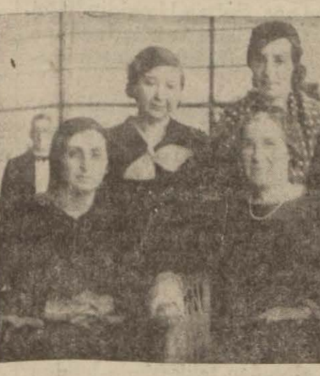
Uluslar arası kadınlar birliği başkanı ile Türk kadınları başkanı bir arada

Dün komisyonların çalışmaları etrafında görüşüldü