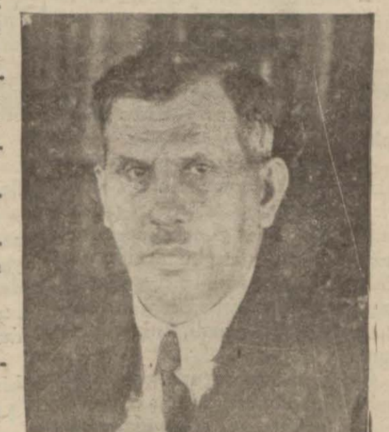
Ulusal Kurultay başkanı Kâzım Özalp

Büyük kurultay başkanı kendisine mülâki olan bir muharririmize (Devamı 7 nci sayıfada)