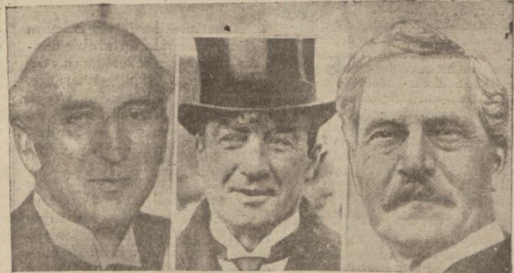
Bugün Fransız bakanları ile Londrada görüşmekte olan İngiliz bakanları: (Soldan) Sir Con Saymen, Baldwin, Makdonald

Eğer Almanya ve Lehistan Şark misakına girmezlerse Fransa ne yapacak?