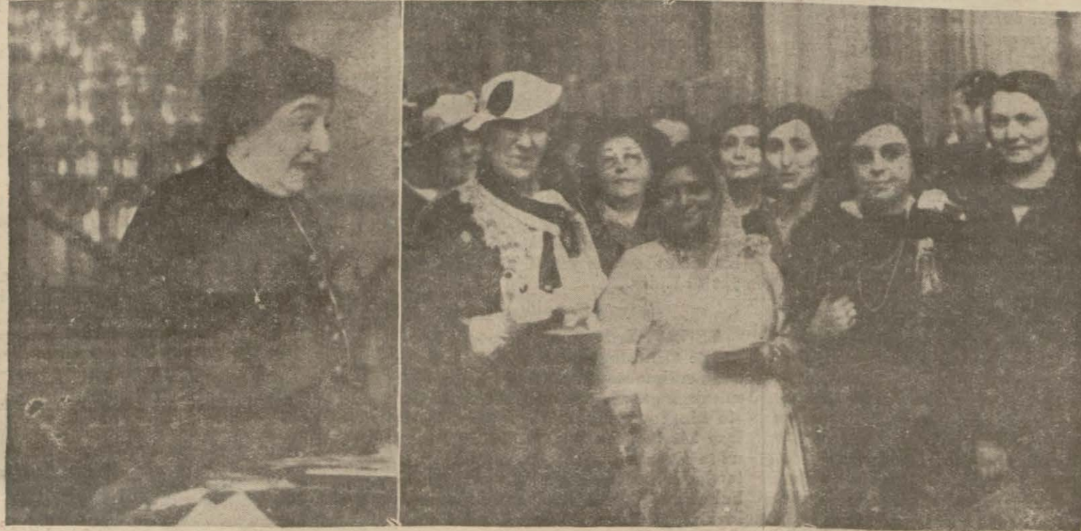
Dolmabahçedeki çay ziyafetine iştirak eden kadınlar, ve Romen murahhası Prenses Kantakuya

Janaikli kadın zenci ırkı- } zencileri tınc etmek acaba nın ıstıraplarını anlattı, } barbarlık değil midir, dedi