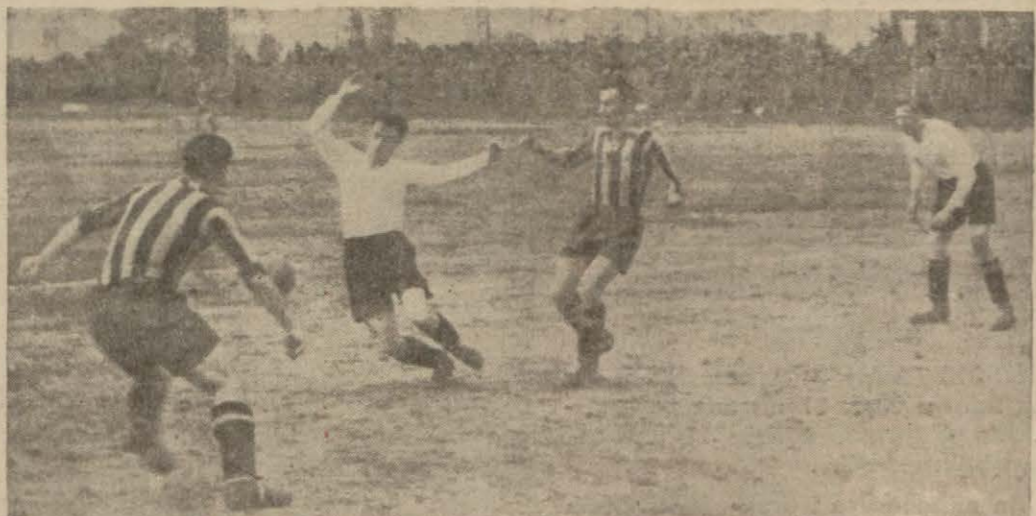
Dünkü maçta heyecanlı bir an

Ufak tefek hadise er o' masa idi mağlûbiyetten az teessür duyacaktık