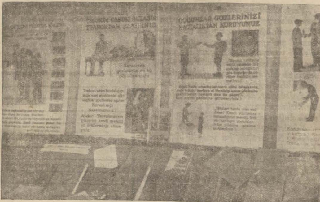
Sergide teşhir edilen eserlerden bazıları