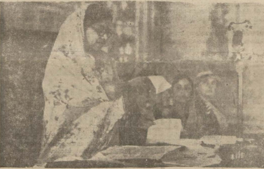
Hint murahhası fikirlerini anlatıyor.