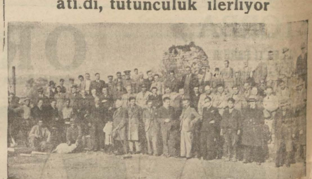
Inhisar idaresi binasının temel atma merasiminden intibalar

MİLÂS, (Milliyet) — Inhisarlar idaresi Milâs tütüncülüğünde büyük bir rol oynamağa başlamıştır. Bu seneki tütün mübayaasında gösterdiği hararet 1931 şenesindenberi can çekmekte olan bu ziraat subemizi yeniden hayata çıkarmıştır denilebilir. Yabancı kumpanyaların karşısına kuvvetli bir rakip olarak çıkmış ve tütün fiatını hiç beklemedik bir yükseltmeye erişmiştir. Bu sene Milâsta tütün fazlasıyla geçen seneye nisbeten çok fazladır. Bütün kış günlerinin yağdırlı gitmesi, bahar mevsiminin yağışlı olması iyi bir mahsulün müjdecisidir.