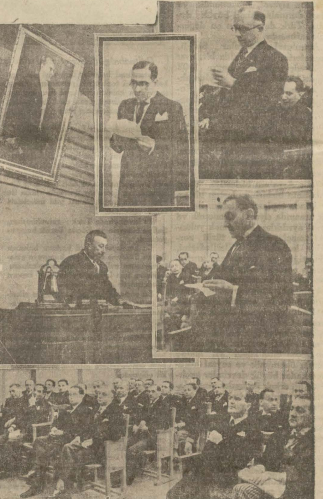
Balkan antanti konseyinin evvelki gün toplantığını telefon havadisini olarak yazmıştık. Yukarıdaki resimlerde açılış nutkunu söyleyen Dış İşler bakanı vekili Bay Şükrü Kayayı, ortada Yunan murahhasını, sağda üstte Romen murahhasını, altta Yu goslavya murahhasını ve en aşağıda da konseyi içtima halinde görüyorsunuz.