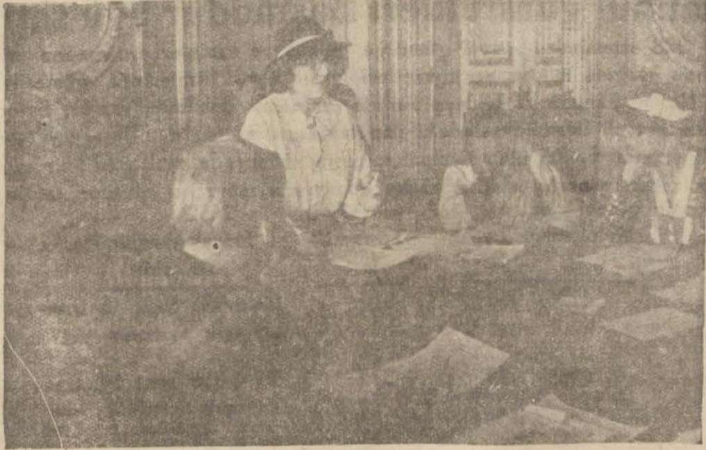
Nafaka komisyonunun bir içtima

— İngilterede böyle bir mecburiyet yoktur. Fakat sebebini bilmiyorum. Zührevi hastalıklar için bir sıhhat vesikası almak belki faydalıdır. Fakat bu her zaman için sayıları itimat değildir. Hastalıklar olup olmadığını kolaylıkla anlaşılmaz. Çünkü bu hastalıkların alameti gizli ve belirsizdir. Her halde bizde evlenmeden evvel bir sıhhat vesikası almağa lüzum yoktur.