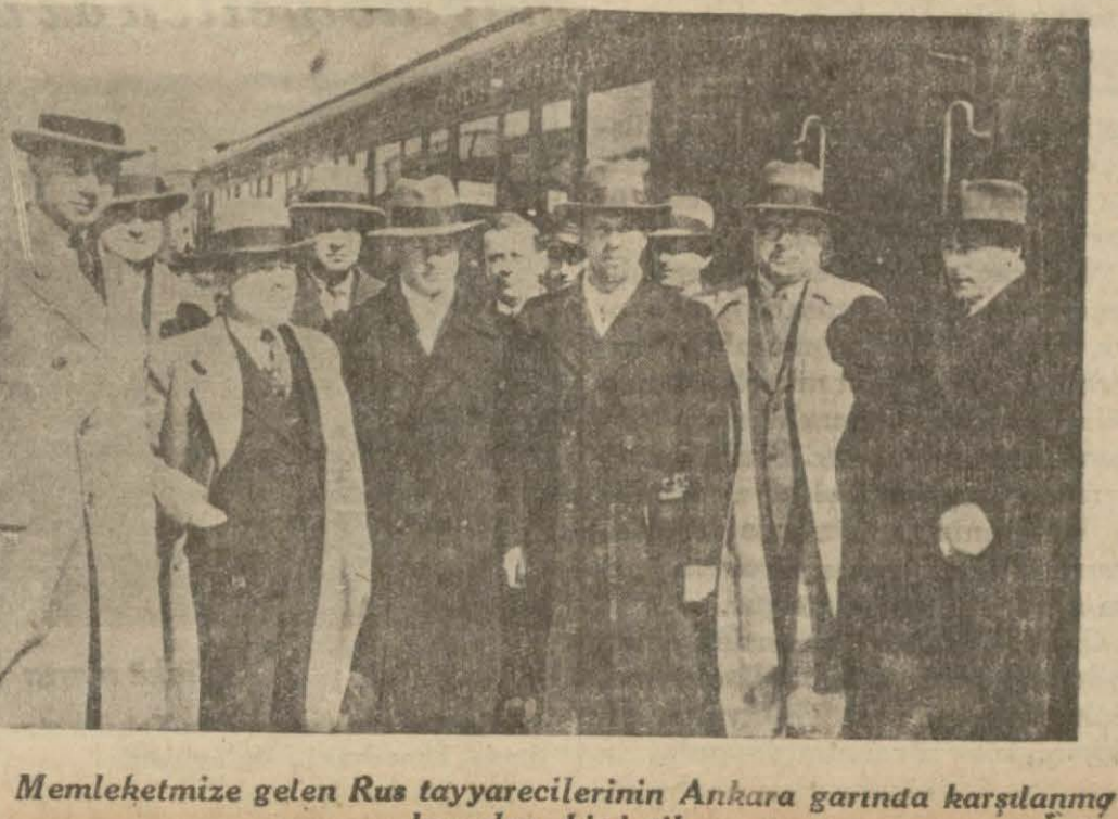
Memleketimize gelen Rus tayyarecilerinin Ankara garında karşılanmaları bir intiba