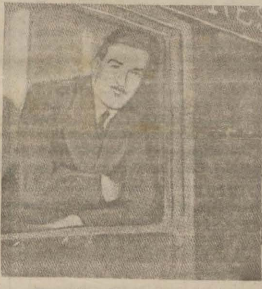
Bay Eden Moskova yolunda