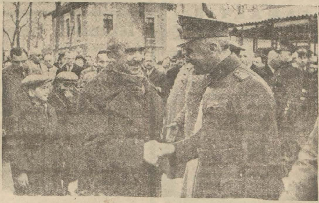
Başbakan İsmet İnönü Anhara istasyonunda hararetle karşılanıyor