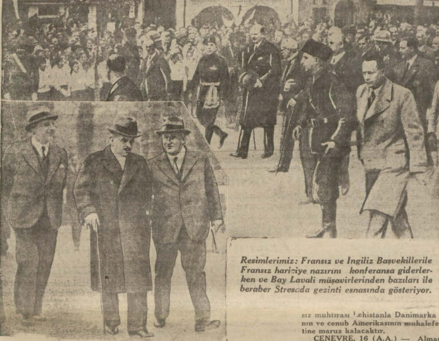
Resimlerimiz: Fransız ve İngiliz Başvekillerile Fransız hariciye nazırını konferansa giderlerken ve Bay Lavalı müşavirlerinden bazıları ile beraber Stresada gezinti esnasında gösteriyor.

Uluslar kurumu konseyi, Fransız muhtırasını bir komisyona havale etti. Lehistan, Danimarka ve Cenubi Amerika Fransız muhtırasını kabul etmiyorlar Uluslar kurumu konseyi B. Lavalı dinledi