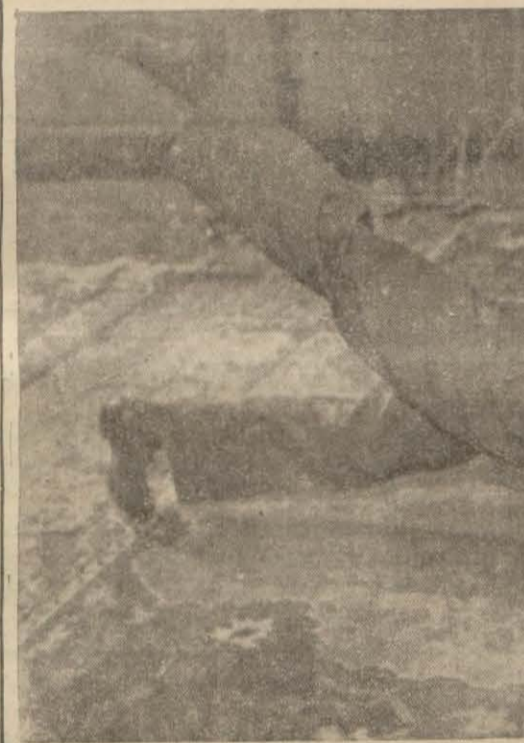
Bay Şefik'in diğeri bir hareketi.