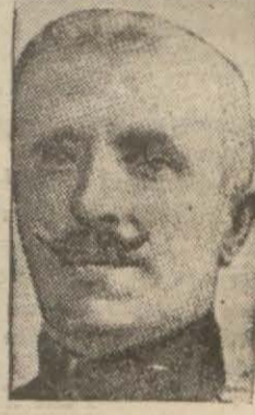
Batalof almadığı anlaşılıyor.

Hariciye nazırı Batalof istifa etti SOFYA, 16 (A.A.) — Kabine azası arasındaki anlaşamamazlık yakında bir buharan çıkmak ihtimalini gösteriyor. Dün akşam, hariciye nazırı Bay Batalofun istifa etmiş olduğu şayi idi. Başvekil bu şayiye tekipten de, Bay Batalofun filhaki istifa eylediği ve istifasını da geri almış olduğu anlaşıyor.