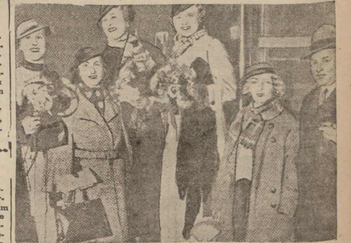
Romaya giden Komedi Fransez sanatçıları

2000 Eski Fransız muharibi Romaya gidiyor - Komedi Fransez sanatçıları Romada - Fransız kız talebesinden mürekkep bir grupda Romaya gitti