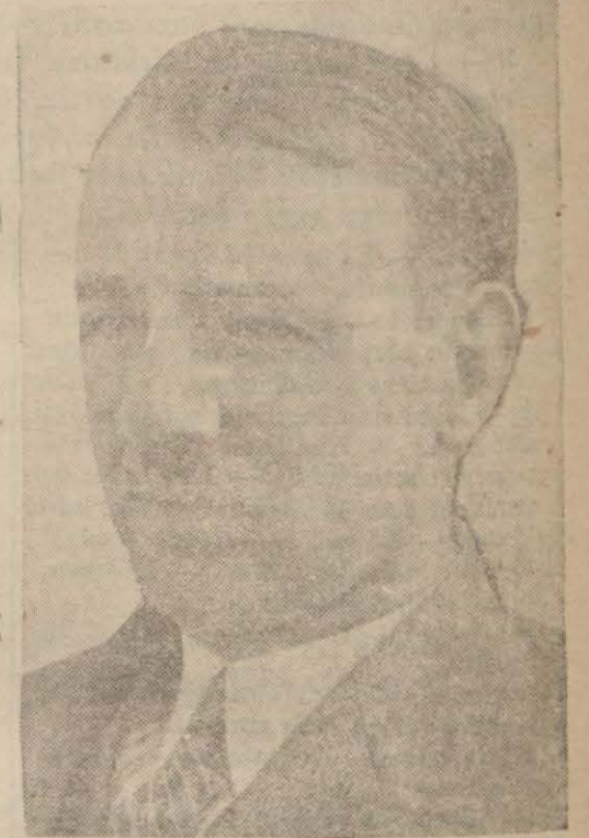
Profesör Fuad Köprülü

PARİS, 9 (A.A.) — (Hususî muhabirimizden) — Paris Üniversitesinde Türk tetkik merkezinde bu yıl için taarrulan bir sıra konferans, edebiyat fakültemizin dekanı Fuad Köprülü'nün birbiri ardına verdiği üç konferansla bitmiştir. Bay Köprülü 13 ve 14 üncü yıllarda Anadolu Türkçülüğünün yüksek ve olgun varlığını anlatan bu üç konferansı ile bizim orta çağımızı aydınlatması bakımından çok önemli ve batı bilgi acunu için de yepyeni görüşler ve belgeler (vesikalar) getirmiştir. Birinci konferansında Fuad Köprülü, Osmanlı devletinin kuruluşu üzerinde şimdiye kadar doğu ve batı tarihçilerinin ileri sürdüğü uyları (fikirleri) gözden geçirerek hepsinin nasıl masallara, Türkler ve Türk tarihi için yüzyıllardır beri süregelen yanlış düğüncelere dayandığını anlattı. Sonra bu araştırmalar için nasıl bir yol atılması gerektiğini göstererek: (Osmanlı devletini Türk tarihi genel çevresi içinde ve Anadolu Selçuk tarihi nin bir süreci olarak almalıdır.) dedi, bu hususta bugüne değin kimsenin asırlanmadığı kaynaklar nelerdir? ana çizgileriyle soruldu: