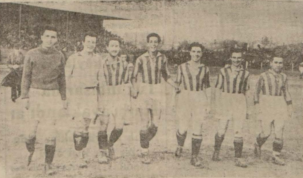
Galatasaray birinci takımından bir grup

Viyana futbolcular yarın gelecek, öğleden sonra ilk maçlarını yapacaklar