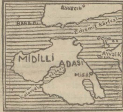
Averof tarafından asker çıkarılarak işgal edilen Midilli adasının bir haritası

Alkonulan Yunan bandıralı üç gemiden Fotiniskara vapuru Kanakaris kumpanyasının malıdır. Şilep olarak kullanılan ve kömür nakliyatı yapan vapurun ikinci kaptanı Bay Mihail Lambos, kendisile görüşen bir muharririmize şunları söylemiştir: — Nikolayefsten gemimize 7,200