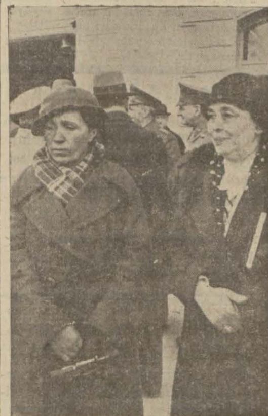
Ankara saygıları Bayan Satı bir sayı arkadaşile beraber

Toplantıdan intibalar Toplantıda 386 sayı bulundu. Kadın saygıların ekserisi siyah kostüm, beyaz bluz giymişlerdi Cumurluk Başkanı seçimi dolayısıyla her tarafta toplar atıldı