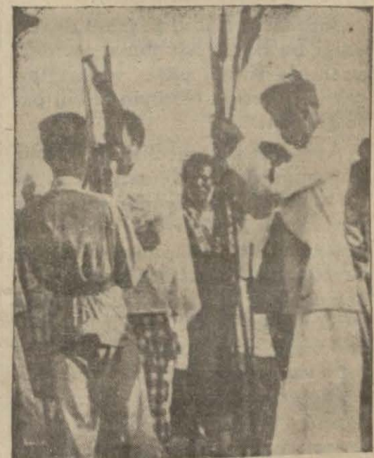
Somalideki yerli askerler