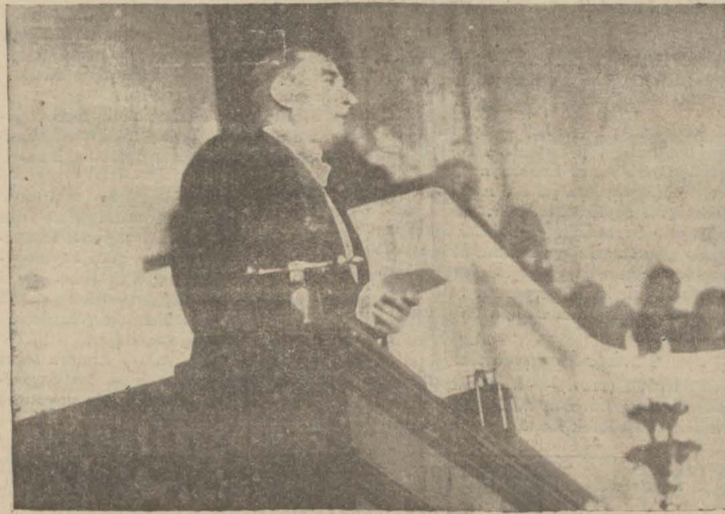
Atatürk Büyük Millet Meclisinde bir söylev verirken