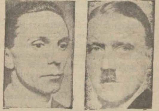
Bay Göbels ve Bay Hitler

BERLIN, 1. A.A. — Sar'ın Almanya ya dönüşü kutlanmalarında bulunmak üzere, Bay Adolf Hitler, tayyare ile Ber-