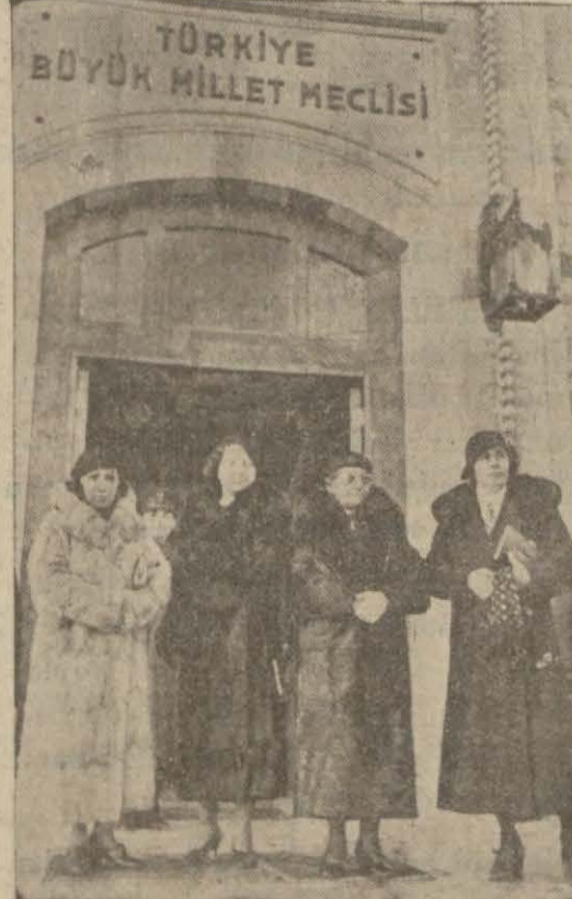
Kadın saygılarından bazıları B. M. Meclisi önünde

ANKARA, 1 (Telefonla) — Beşinci Büyük Millet Meclisinin bugünkü birinci toplantısı fasılasız beş saat bir çeyrek devam et-