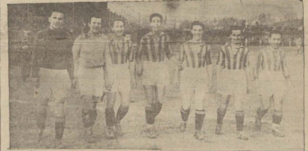
Maçtan sonra Galatasaraylılar ve maça heyecanlı bir an

Şampiyon tayini için üçüncü bir Galatasaray - Fener maçı yapılması lâzım gelecek