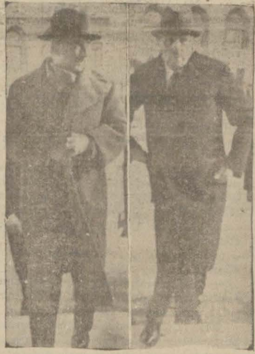
General İsmet İnönü ve Millî Müdafaa Bakanı General Kâzım Özalp, evvelki gün Fırka Meclis grubu toplantısından çıkarken

demokrasi kurarken anarşi içine düştü. Bunun tepkisi, (aksülâmel) olarak bir takım ülkelerde diktatörlükler kuruldu. Biz Cumurlukta bize en uygun olan kurumu bulduk. Bu, on beş yılın denemisini taşıyan ve gittikçe pekleşen bir rejimdir. Bu rejim altında Türk ulusu kurtuldu, ilerledi, yükseldi, büyük işler başardı.