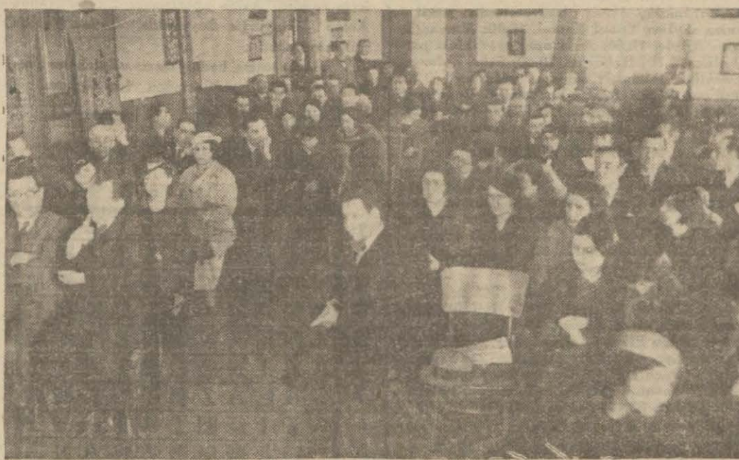
İstanbul muallimlerinin dünkü toplantısından bir intiba