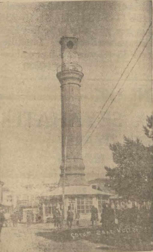
Çorumda saat kulesi ve hükümet daresi

İhale günü 3-4-935 çarşamba günüdür. Teklif zarfları o gün saat on dört kadar Müdürlüğe verilmelidir. Bu saatten sonra getirilecek zarflar alınmaz. Eksiltmeye girmek isteyenler Taksimde Sıraservilerdeki İdare binasında vezneye uğrayıp bir lira vererek şartnameyi alabilirler. (1486)