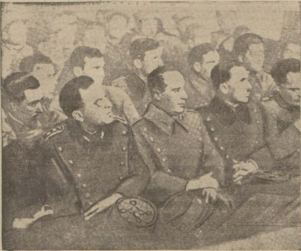
Asi zabıtlardan bir kısmı Divanı harb huzurunda

İsyan hareketini idare eden reislerin bütün tertibatı, plânları meydana çıktı