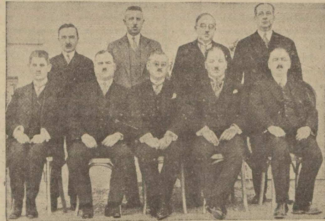
Bugün Türkiyemizin en kuvvetli ve yüksek bir millî ve iktisadî teşekkülü haline girmiş bulunan İş Bankasının ilk idare meclisi azası

Bankanın idare meclisi raporu ve bilançosu 5 inci sahifemizedir.