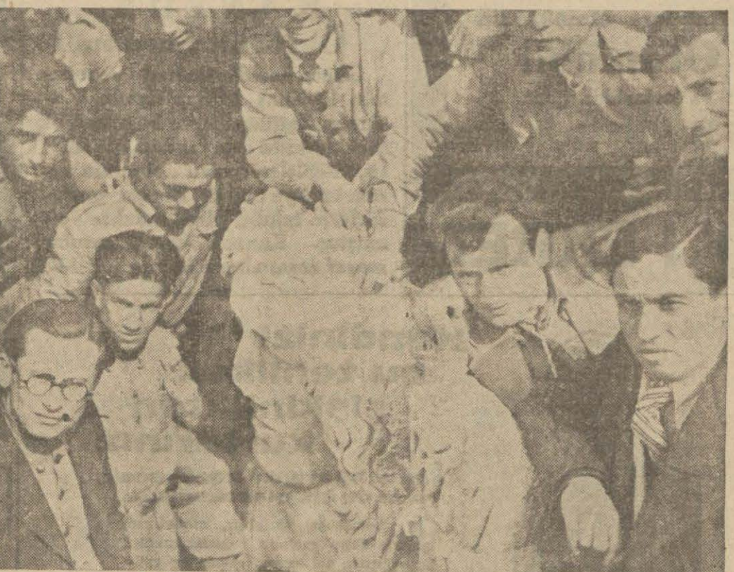
Kütahya halkevi köycüleri Çavdarhisar harabelerinde...

Tedkik ettikleri köylerden bahseden bir broşür çıkaracaklar. Tedkikleri tezelden yapmak için atlı kol teşkil edildi