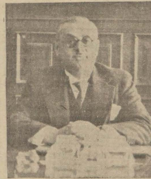
İş Bankasının olgun çalışması ve varlığı ile bugünkü haline yükselten İktisat Bakanı Bay Celâl Bayarın bankadaki umumî müdürlüğü esnasında çekilmiş bir fotografisi

Bankanın idare meclisi raporu ve bilançosu 5 inci sahifemizedir.