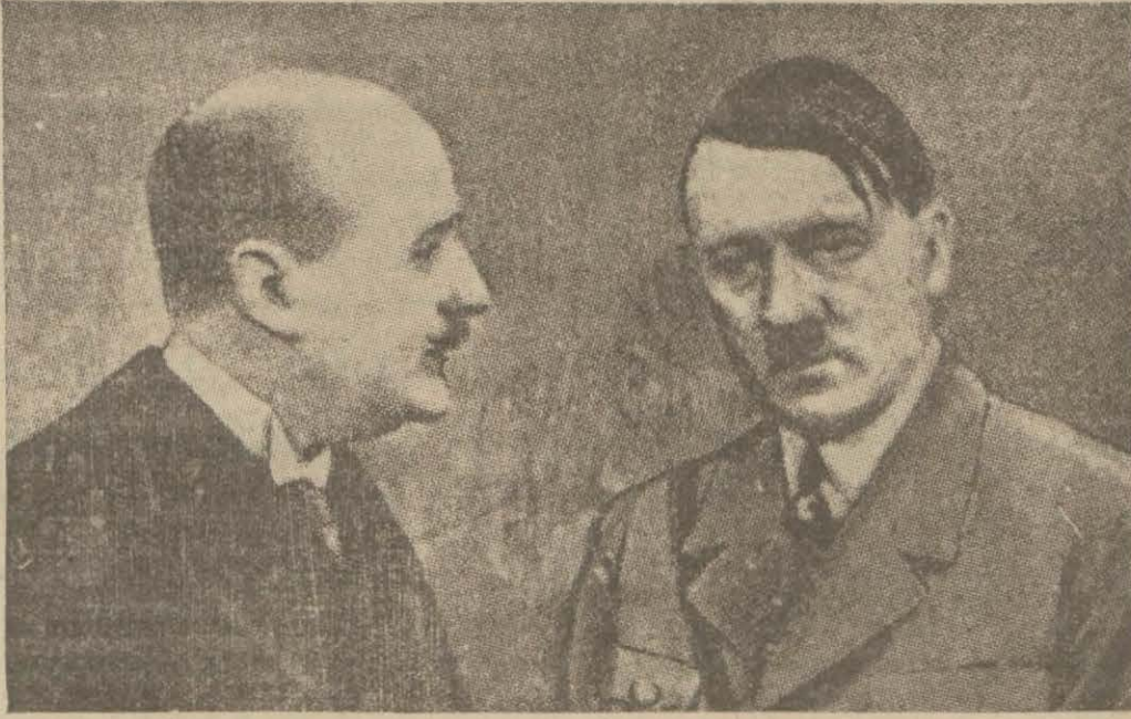
Bay Hitler Fransız sefiri Bay François - Poncet ile görüşüyor

ROMA, 24 (A.A.) — Jurnale d'Italya gazetesi 1911 sınıfının silâh altına alınması hakkında diyor ki: Bu tedbir, silâh kuvvetlerin her türlü ihtimale karşı vaziyete hâkim bir halde bulunmasını temin için ihtiyatî bir gayeye matuftur. İtalyada halen silâh altında üç sınıf vardır. Bu da 600 bin kişi tutmaktadır. Tribune gazetesi yazıyor: Bay Mussolini'nin siyaseti daima matuf olduğunun tekrara lüzum yoktur. Fakat barışı teminat altına almak için gafil avlanmaya tamamen azmetmiş olmak lâzımdır. Bu yeni vakıaların, bir şarttır tevhit etmemesi için bunları metanetle karşılayan Faşizmin hattı hareketidir.