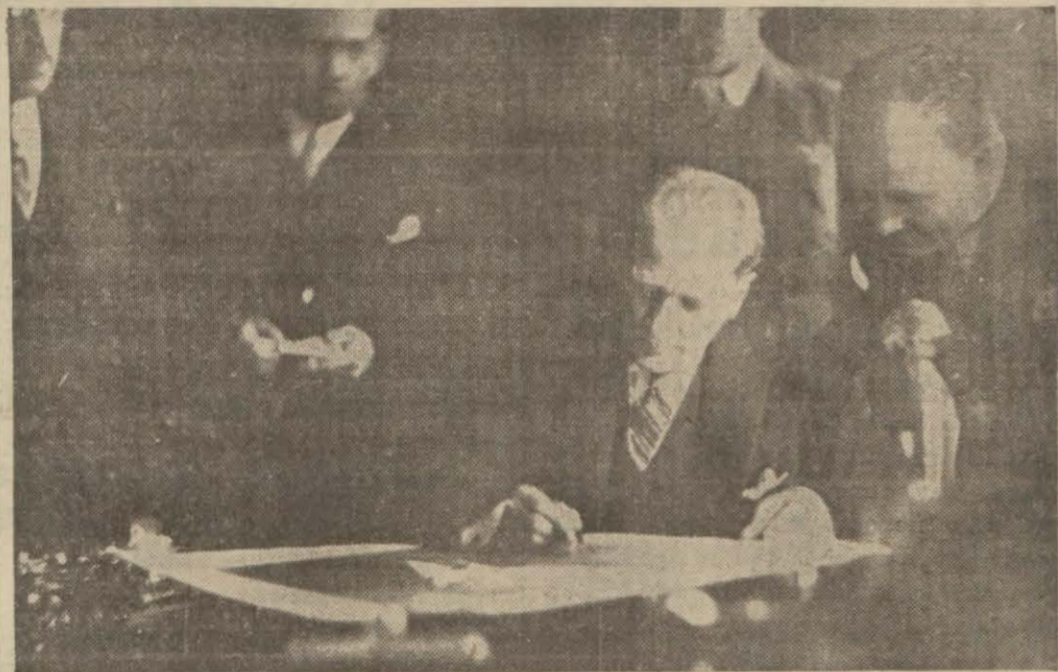
Atatürk kendi eseri İş Bankası'nın kuruluş yılında Bankada.

neşrederek, eski düşman memleketler, Almanyamın yemiden tesis ettiği mecburi askerlik hizmeti usulünü taklit ettikleri takdirde, ordularını seferber edeceklerini bildireceklerdir.