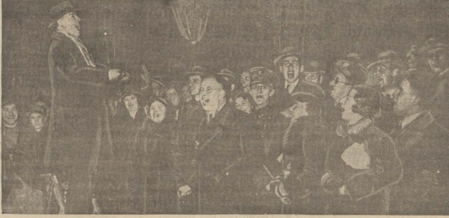
Almanya'da mecburi askerliğin ihdası üzerine halk sevinç içinde milli marşı söylerken

Bugünkü uluslararası faaliyetinin hülâsası, bir yandan Almanyanın Versailles kurumunu bozmak, öte yandan da belki azıcık geç bir araya gelebilen is-