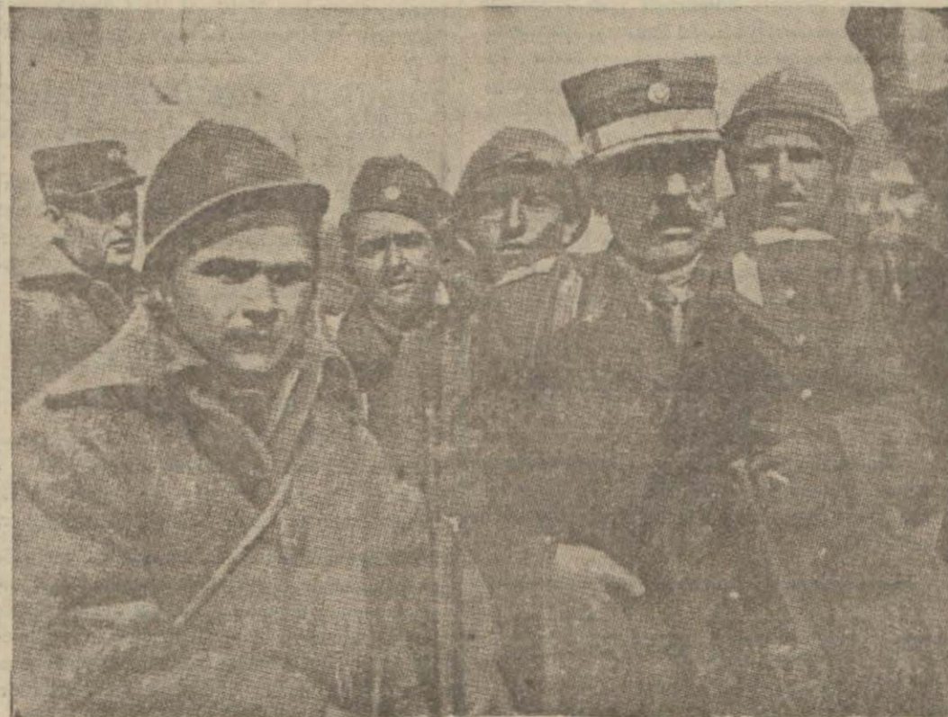
Yunan isyanını süratle tenkil eden General Kondilisin son hareket esnasında alınmış bir resmi

Yunan âsi kumandan ve zabitle rinden geçenlerde Midilliden topraklarımıza iltica etmiş olan on üç kişilik bir grup dün sabah Mersin vapur ile Çanakkale'ye şehrimize gelmiş-