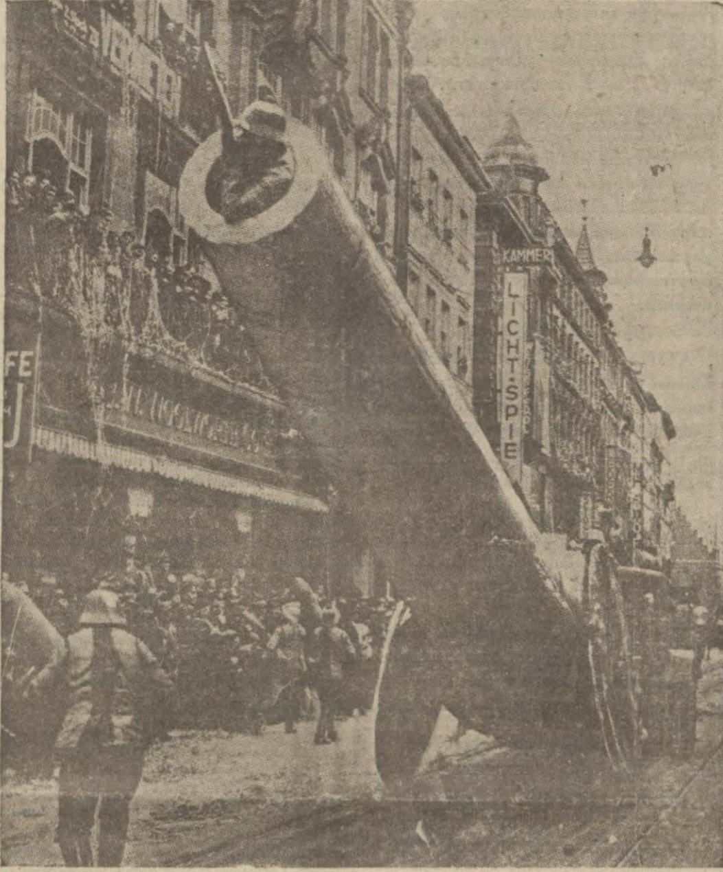
Almanyada karnaval şenlikleri esnasında bile sokaklarda muazzam toplar dolaştırıldı.

Börsen Çaytung gazetesi, Fransız politikasına yaptığı şiddetli bir hücum. (Devamı 6 nci sahifede)