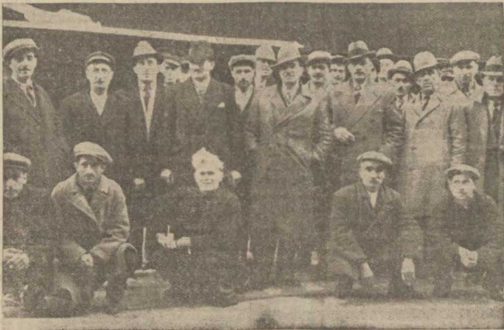
Gemiye almağa gelen Yunanlı kaptan ve tayfalar

Berlirliler hava bakanlığının talimatını aynen tatbik etmişlerdir. Tayyarelere karşı müdafaa teşkilâtının havada bir mümessili vardı ve teşkilât mükemmel bir surette işlemiştir.