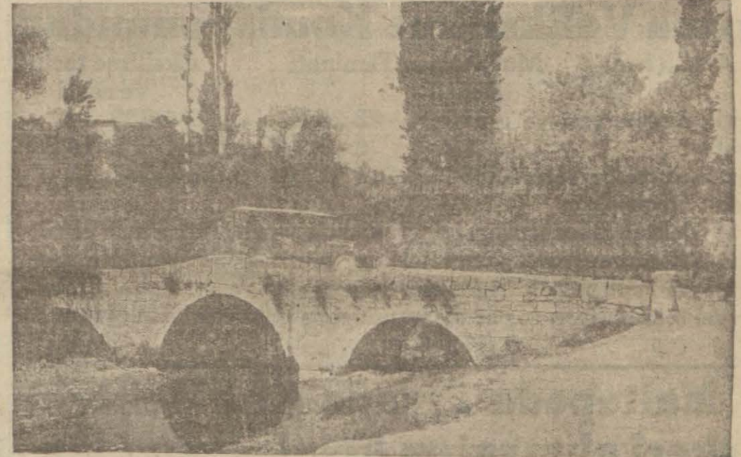
Konyanın Meram tarafları

giştirmiştir. Vilâyetin orta ve şark tarafları, vasatî yüksekliği bin metreyi bulan geniş düzlüklerden ibarettir. Cenubi Toros sırtlarına kadar uzandığı için arızalıdır. Garp tarafı, Antalya körfezinin şarkından itibaren, Orta Anadolu yaylâsını garptan çevirmek üzere şimaligarp istikametine kıvrılarak silik bir şekilde uzanan Toros kırışıklıklarıyla çevrilmiştir. Toros kırışıklıkları peyda olurken vilâyetin düz bir tabla manzarasını gösteren kısmı takmile çökünce çöküntüsünün zayıf kalan tarafında indifalar hasıl olmuştur.