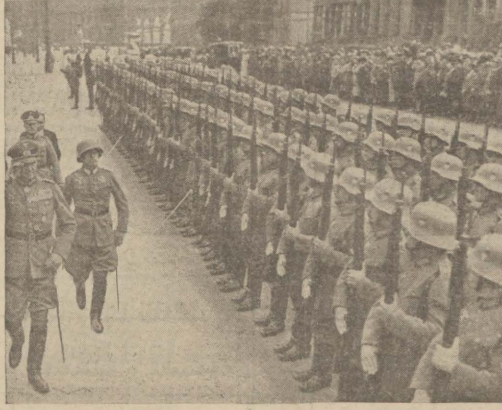
Alman askerleri bir manevra esnasında

vetler muvazenesine doğru gidiyor. Bir taraftan Fransa, İtalya, Rusya ve bunlara bağlı devletler. Öte taraftan Almanya, Lehistan ve bunlara bağlı devletler. Bu muvazenede İngiltere de tarihi rolünü oynamaya başladı: Kuvvetler muvazenesinin tam olmasına itina etmek. Kâh bir, kâh diğer tarafla beraber imiş gibi görünerek bir tarafın ağırlığı kahir ve kendi emniyet ve menfaati noktasından tehlikeli olmadıkça hiç bir tarafa iltihak etmiyerek iki yüzlü bir siyasa güdmek. Ve tehlike sezdiği vakitte işe karışarak bu gidişi kendi maksadına uygun bir çıkış vermek. A. Şükri ESMEK