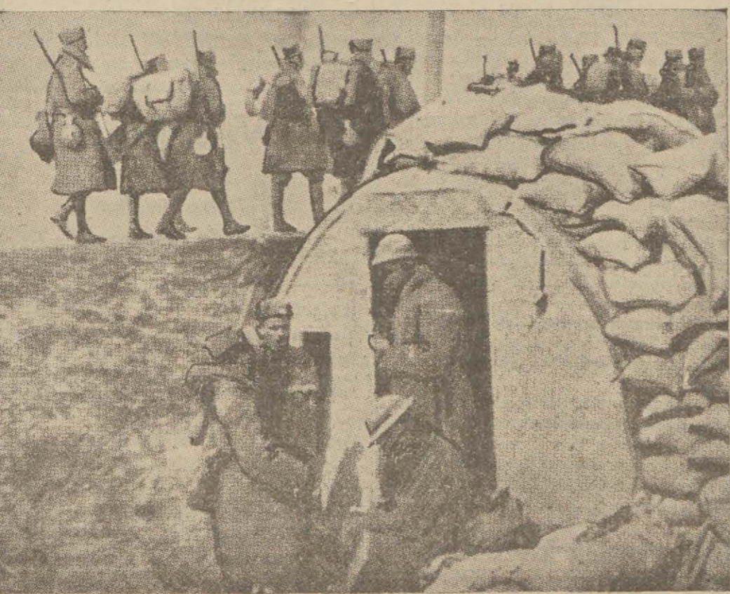
İsyanı bastıran Yunan kıtaatı avdet ediyor

Daily Telegraph yazıyor: Bu karar, İngiltere hükümetinin, Fransız - İngiliz tebliğinde bildirdiği veçhile umumi bir anlaşma için bütün gayretlerini sarfettiğini göstermek hususunda, herkesi ikna edecektir.