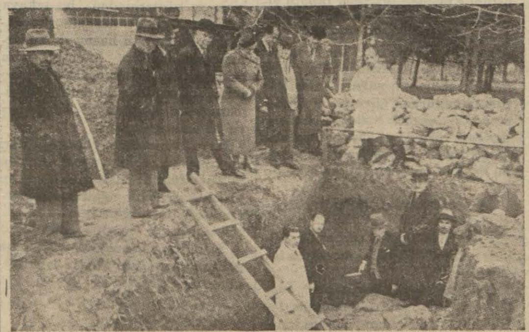
Yakın yıllarda İstanbul Verem Mücadele Cemiyeti tarafından kurulan Erenköy Verem Sanatoryomuna yeni bir pavyon eklenmesi için dün