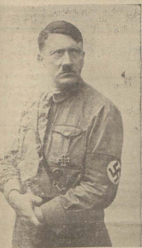
Bay Hitler nasyonal sosyalist üniformasile

BERLIN, 19 (A.A.) — Propaganda nazırı Bay Göbels, (Mantıklı vuzuh) namıyla nesretmiş olduğu bir makalede bilhassa diyor ki: «Alman efkârı umumiyesi, Almanya'da mecburi askerlik hizmetinin yeniden tesis edilmesinin ecebî paytahtlarında hasıl etmiş olduğu aktümelenden pek ziyade hayrete düşmüştür.» Bay Göbels, resmi ecnebi mahafilin Almanyanın teslihatı halında vuzuh ve sarahat istemiştir.