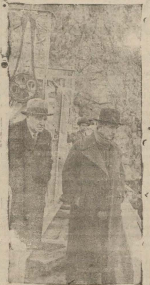
Başbakan İsmet İnönü, Nafta Bakan Bay Ali Çetinkaya ile birlikte Ankarada Çubuksu bendinde inşaat ve faaliyeti tetkik ediyorlar.