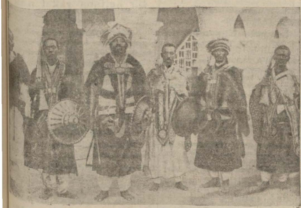
Çete halinde Habeş cengâverleri