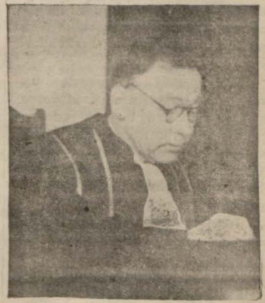
Türk - Yunan Muhtelit Hakem Mahkemesi Başkanı Boeg