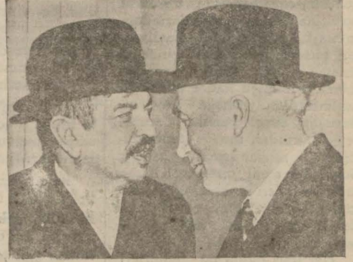
Pariste mühim müzakerelerde bulunan Fransız ve İngiliz hariciye nazırları Laval ve Con Simon

PARIS, 28 (A.A.) — Sir Con Simonun bugün saat 11,30 da Londradan tayyare ile gelmesi bekleniyor. Sir Con Simon, İngilterenin Paris sefirine misafir olacak ve verilecek bir öğle ziyafetinde Bay Laval ile Bay Kampbell hazır bulunacaklardır. Bay Kampbell, fevkalâde Murahhas olarak bulunmaktadır. Londra anlaşmalarına müteallik müzakerelere ve Sir Simon'un Berlin ziyaretine dair iki dış işleri bakanı bu ziyafette ve öğleden sonra görüşmelerini karşılaştıracaklardır.