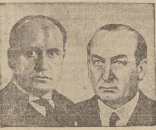
M. Mussolini ve M. Gömböş

M. Gömböşün Alman nufuzu ile İtalyan dostluğu arasındaki vaziyeti hakkında M. Mussolinive teminat vermiş olması muhtemeldir