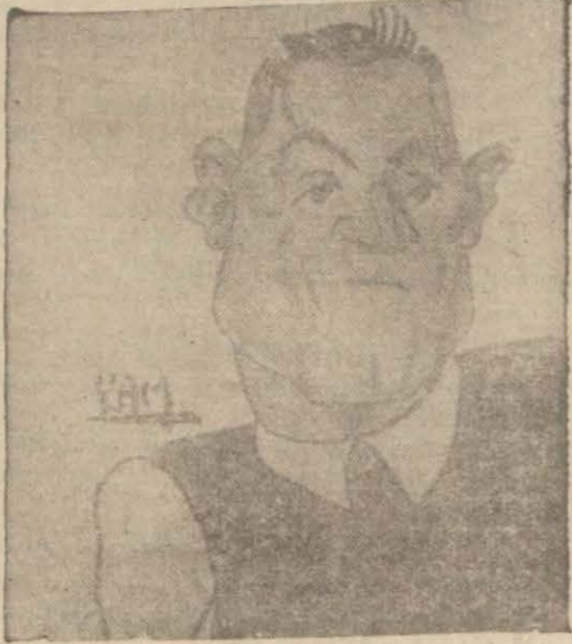
İngiltere takımı müdafilerinden Koping

"Yurttaşlarımız haftaymızda İngil- tere - İtalya maçının sayısını öğren- dikleri zaman gülümsemişlerdi. Fakat kat'i netice anlaşıldığı za- man, yüzlerini eksittiler. Birçok mutaassıplar, on İtalyanım, kırk beş dakika içinde, on bir İngiliz 2 - 0 yeneceğine inanıyorlardı. Bana gelince, hakımı teslim et- mek lâzımdır, hadisat tahminim gibi çıktı. Son senelerde İtalya, Portekiz ve Fransada birçok fut- bol takımlarına antrenörlük ettim. Avrupada futbolun geniş terakki gördüm. Çok defa İngilterede ki dostlarıma, futboldeki şöhretle- rinin tehdit edilmekte olduğunu haber verdim. Burnuma güldüler. İdareciler, menecerler, antrenör- ler, oyuncular benimle alay ettiler. Onların fikrinde böyle bir şey ola- mazdı ve bütün İngiltere "şahane teccerrüt" üne güvenerek rahat u- yudu. 1929 da İspanya kendi top- raklarında İngiltereyi yendi. 1930 da Avusturya beraberliği temin et- ti, 1931 de Fransa galip çıktı. 1932 de, İngiltere (harika takımı) güç- lükle yeniyordu. 1933 te İtalya İn- giliz üstatlara kafa tutuyordu. 934