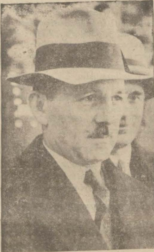
Saraçoğlu Şükrü Beyin dün aldığımız bir portresi

Adliye Vekili Saraçoğlu Şükrü Bey dün sabah şehrimize gelmiştir. Pera-palası oteline inmiştir. Şükrü Bey dün otelde kendisini ziyarete gelen dostlarını kabul etmiş ve hususî işleri ile meşgul olmuştur. Bugün Adliyeye gid-