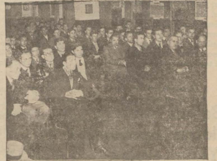
İstanbuldaki Edirneliler dün Halkevinde toplandı ve kurtuluşlarını kutuladılar ..

Bugün Edirnenin kurtuluş bayramıdır. Bu mutlu günün bu sene her yıldan daha parlak ve daha coşkulu sunu rette kutulanması için haftalardan beri yapılmakta olan hazırlıklar bitmiştir. Şehir bayraklar, taklar, kürsüler, tribünler ve yeşilliklerle süslenmiştir. Trenler iki gündü beri İstanbuldan, Ankaradan ve Trakyanın muhtelif yerlerinden akm akm halk taşımaktadır. Dün akşamki hususî tenezzüh treniyle de 250 kişilik bir kafile gelmiştir. Gelenler arasında kırk kadar mebusla İstanbul Üniversitesi, Mülkiye, Mühendis ve Yüksek Ticaret mekteplerine mensup öğrenciler de (Devamı 5 inci sahifede)