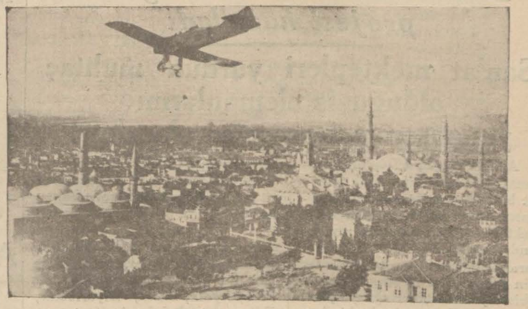
Dün kurtuluş bayramını kutulayan güzel Edirnedeki bir görünüş

M. Salâhaddin Güngör Beyin özdil yazısı 4 üncü sayfada