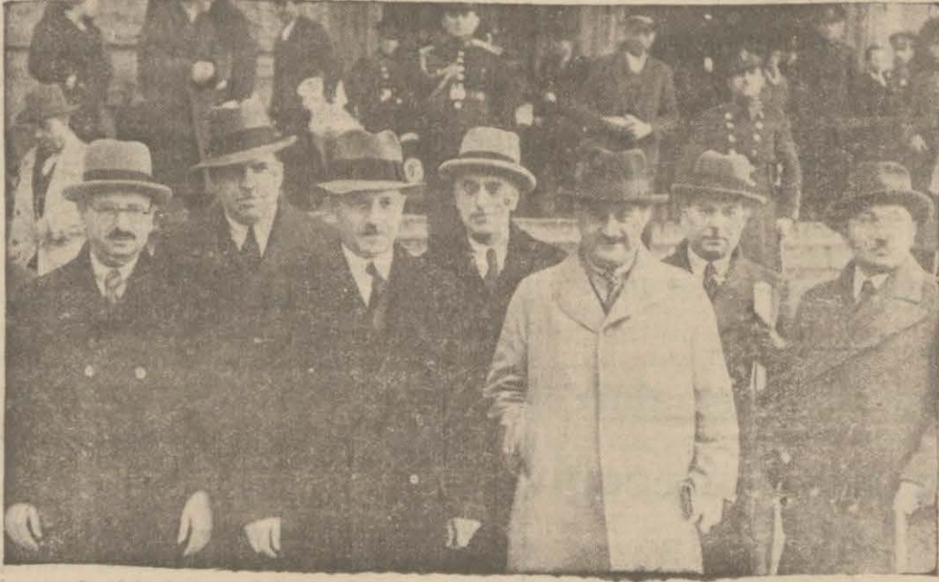
'Adliye Vekili Saraçoğlu Şükrü Bey Haydarpaşa istasyonunda.