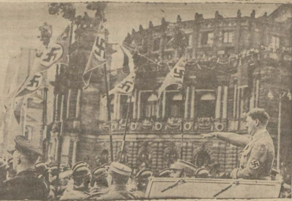
Versailles antlaşmasını dilde de gül, işte hiçe sayan M. Hitler