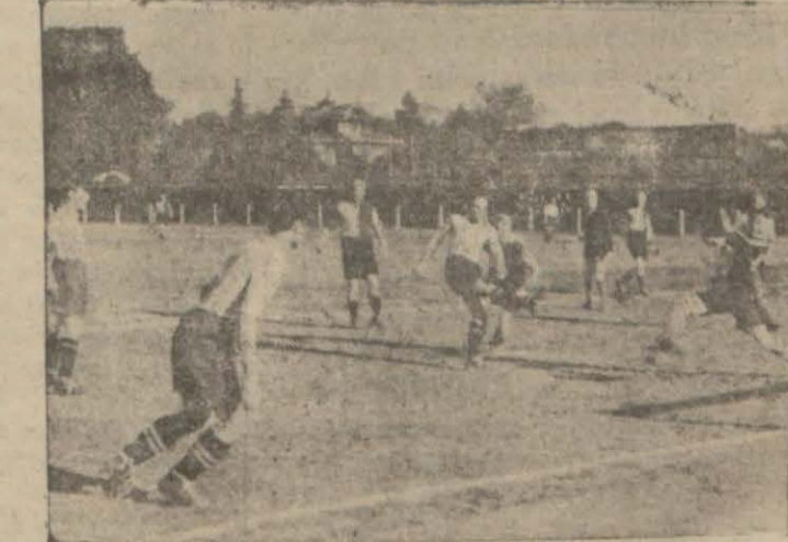
Fenerbahçe - Forbisher maçıdan bir intiba

Limanımızı ziyaret edeceklerini yazdığımız kumandan Torster'in kumandası altında bulunan İngilterenin Forbisher mektep kruvazörü dün sabah saat yedide limanımıza gelmiştir. Forbisher top atmak suretile şehri selâmlamış, bu toplara Selimiyyeden atılan toplarla mukabele edilmiştir. Kumandan Muhittin Bey ve İstambul kumandanı Halis Paşayı ziyaret etmiş