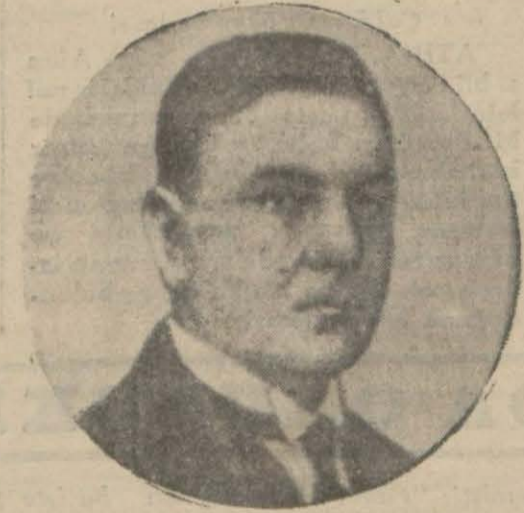
Ustaşi tethiş komitesi reisi Pavliç

Ustaşi Reisi Fransadan suikasttan evvel ayrılmış ve oradan İtalyaya geçmiştir