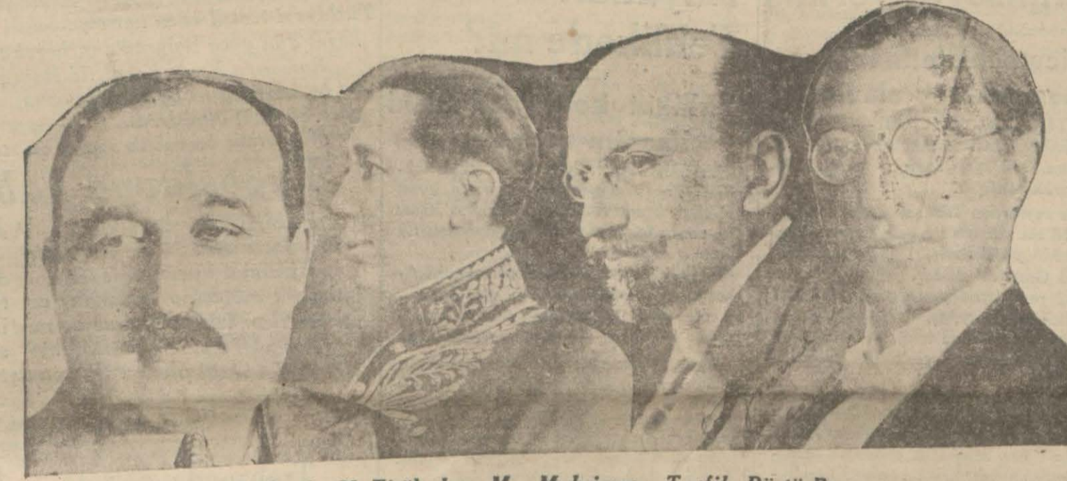
M. Yevtiç, M. Titulesko, M. Maksimos, Tefvik Rüştü Bey

BELGRAT, 20. A.A.— Uç devletin hariciye nazırlarından mürekkep olan küçük itilâf daimi meclisi, dün sabah saat 10,30 da Yugoslavya hariciye nazırı M. Yevtiç'in kabinesinde toplanmıştır.