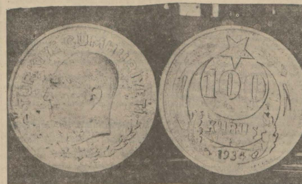
Yeni gümüş liralardan kabul edilen son şekli Yeni gümüş paraların bu hafta içinde basılmasına başlanacağı anlaşılmıştır. Paraların çelik kalıpları yapılmıştır. (Devamı 5 inci sahifede)