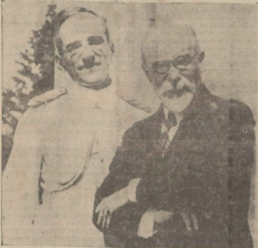
M. Barthou son Belgrat ziyareti esnasında Kral Aleksandr ile bir arada...

Hırvat mebusu doktor Ante Paveliç ve Hırvat merkezi hükümeti Zagreb be-