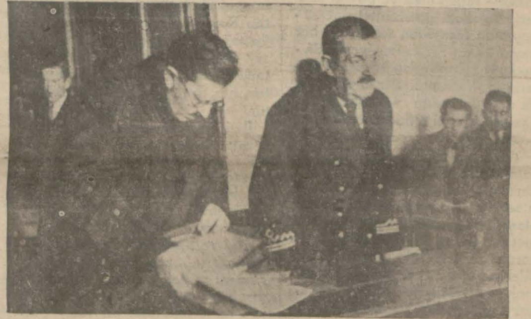
Feruzan süvarisi mahkemede izahat veriyor