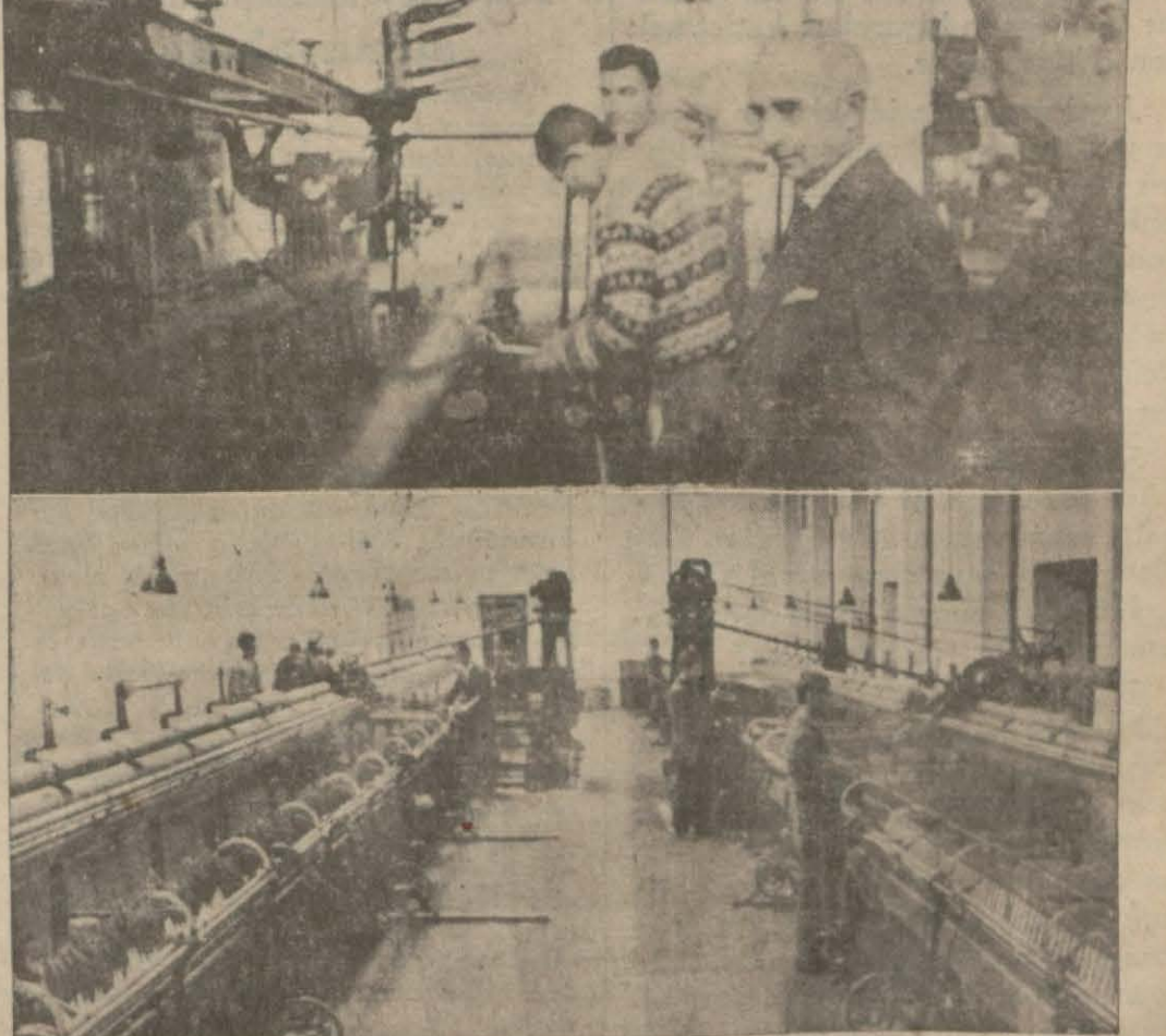
Başvekil İsmet Paşa Hz. Ankara'da İş Bankasının Yünis fabrikasında tethikat yapıyorlar...

Heybeliada açıklarında vukuagelen ve 33 vatandaşın ölümü ile neticelenen facia tahkikati devam etmektedir. Yalovada alınan ifadeler tamamen tesbit edilmiş ve dün Heybeliada (Devamı 4 üncü sahifede)