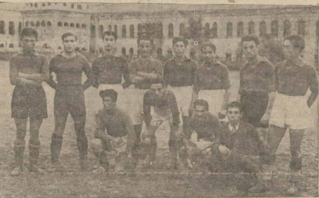
Beş gol ile Beylerbeyi mağlup eden Topkapı takımı

İkinci devrede bir şey gözümüze çarptı. Süleymaniye'nin müdafii Necdet arkadaşlarına kızdı mı, darıldı mı, ne oldu bilmeyiz, tam yirmi dakika ve sanki hazır ol vaziyetinde sahanın içinde dura-