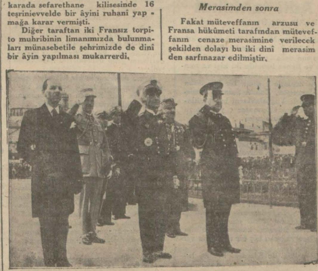
Fransızlar âbi denin önünde

Limanımızda misafir bulunan Fransanın Cuepard ve Cassard torpito muhripleri zabitan ve efradı dün şehirde gezintiler yapmışlardır. Halktan bazıları da gemileri gezmişlerdir. Amiral Rivet dün sabah refakatinde maiyeti zabıtları bulunduğu halde Taksime giderek abideye mükellef bir çelenk koymuştur. Bu sırada bir müfreze efrat önünde selâm vaziyetinde durmuştur. Merasim esnasında Fransa sefaretî ateşemilileri Kolonel de Courson ve ateşnaval kumandanı Rouch da amiral Rivet'ye refakat etmekte idiler. İki dini merasimden sarfınazar edildi. Fransız sefaretî feci surette öldürülen Fransa Hariciye nazırı Mösyö Barthou'nun istirahatî ruhu için Ankarada sefarethane kilisesinde 16 tesrinievvelde bir âyini ruhani yapmağa karar vermiştir. Diğer taraftan iki Fransız torpito muhribinin limanımızda bulunmaları münasebetile şehrimizde de dini bir âyin yapılması mukarredir.