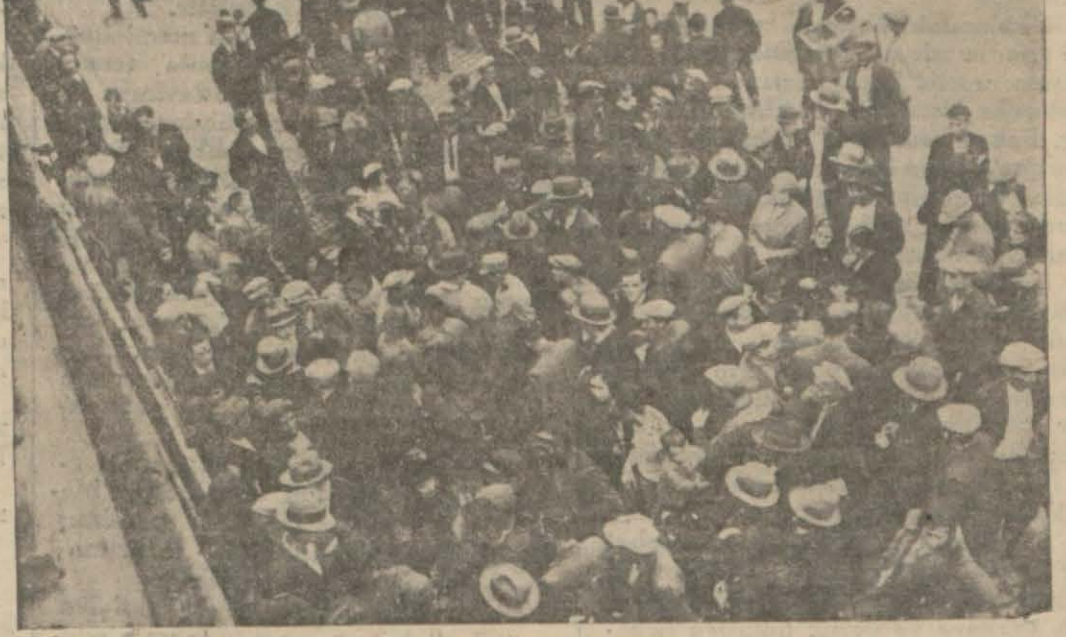
İntihap sandıkları başındaki kalabalık

Yeni şehir meclisine doğru İntihap dün gece bitti, tasnife bugün başlanıyor Netice salı günü belli olacak