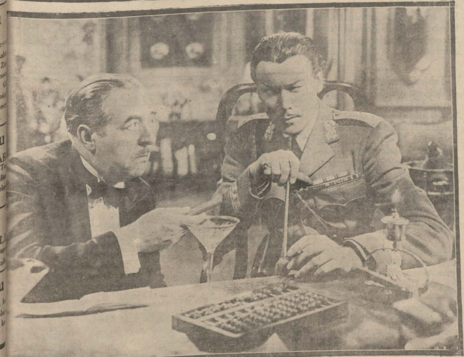
Je neral Yen'in zehirli çayından bir sahne