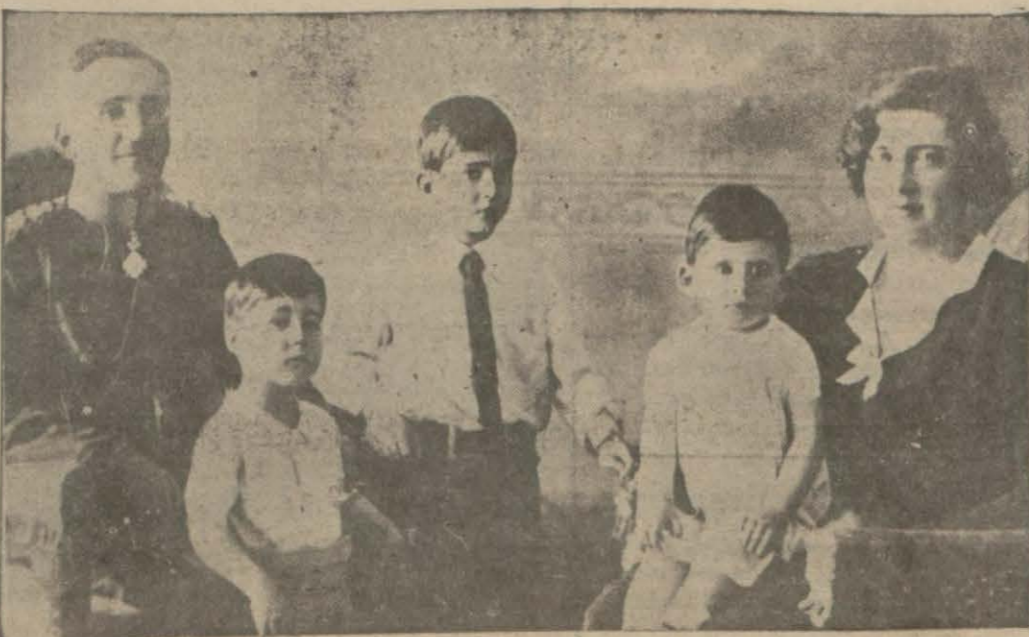
Müteveffa kral Hz. ailesile bir arada (Ortada ayakta veliaht Piyer görülme ktedir.