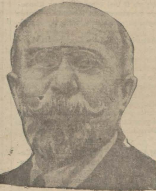
Ölümü büyük teessürle karşılanan dost Fransanın Hariciye Nazırı M. Barthou