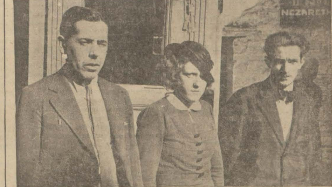
Kaçakçı şebekesinin ele başları Emniyet müdürlüğünde

Bu beyaz düşman şebekesi nasıl çalışıyordu?