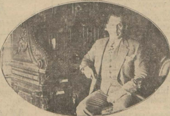
Büyük Millet Meclisi Reisi Kâzım Paşa Hazretleri Domabahçedeki mesai odalarında . .

Evvelki gün şehrimizi ze gelmiş olan Büyük Millet Meclisi Reisi Kâzım Paşa Hz. öğleden sonra Yalovaya gide-rek Gazi Hz. tarafın-dan kabul edilmişler ve akşamı tekrar İ-s-tanbula avdet buyur-muşlardır. Paşa Haz-retleri dün bizi Dolma bahçe sarayında kabul ederek şayanı dikkat beyanatta bulunmuş-lardır. Büyük Millet Meclisinin geçen içti-ma devresinin verimle-ri hakkında sorduğu