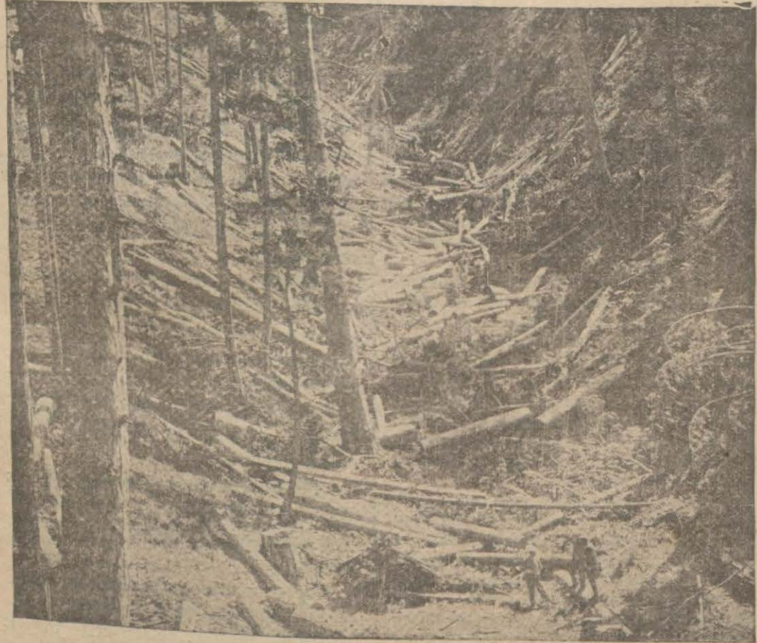
Kunduz ormanlarında kesme ameliyesi

Kunduz ormanlarında katıyayı nasıl yapıyor, keresteler nasıl hazırlanıyor