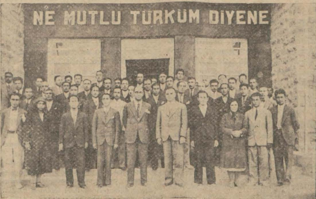
Elâzizde kursa iştirak eden muallimler.

Muallimler için açılan kursta samimî toplantılar ve temaslar yapıldı