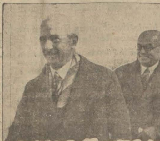
Başvekil İsmet Paşa Hz. ve İktisat Vekili Celâl Bey

Üç yeni fabrikanın bu hafta temelleri atılıyor