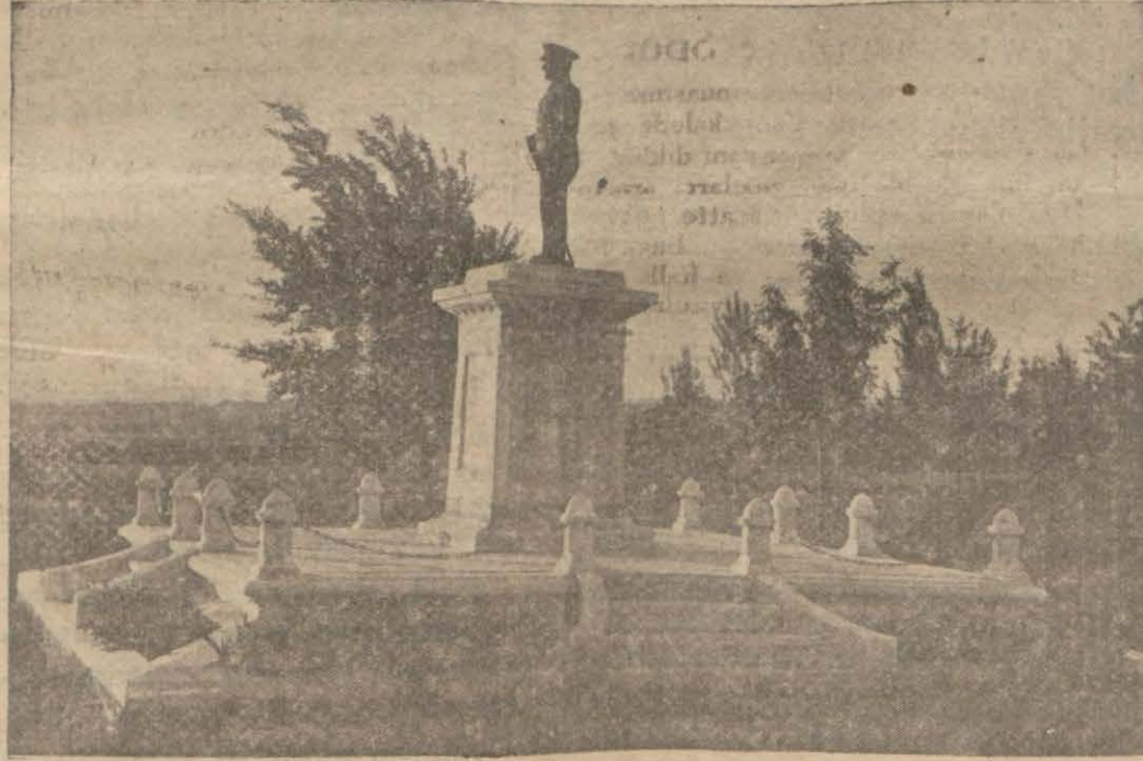
Çorumda Gazi heykeli

Çorumluların zaman mefhumuna verdikleri kıymete iştirak edebilmek için zaman lokantasında lezzetine doyulmaz kebab yemiye başladım.