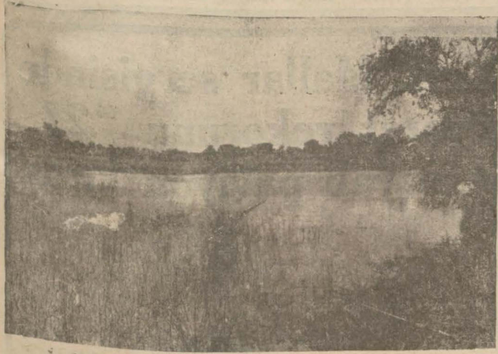
Aydın vilâyetinde Çınarlar bataklığı

Köylünün yalnız sıhhati korunmuş ol- mayor, erazi de temin edilmiş oluyor