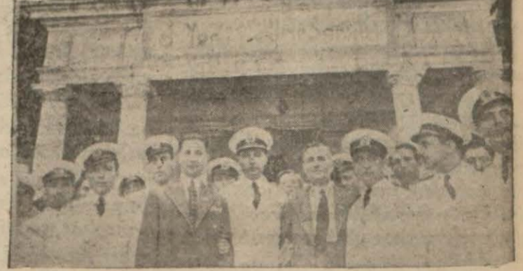
Yunan tayyarecileri Yerlimalar sergisinde.