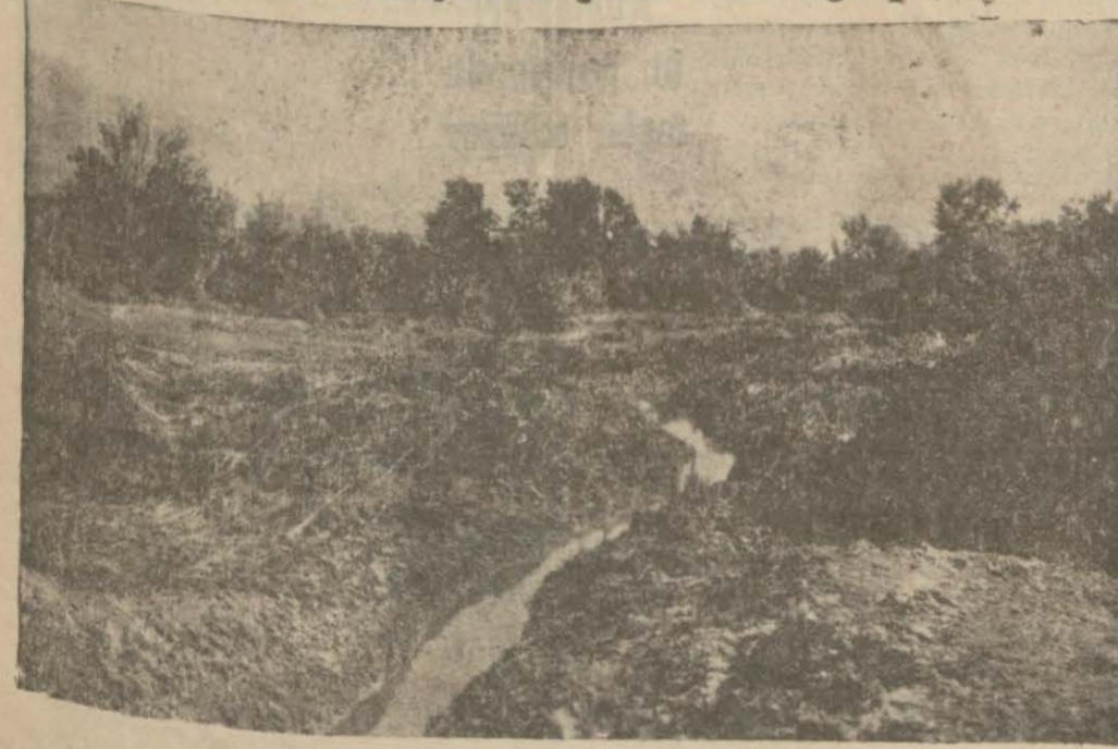
Çınarlar bataklığı kurutulduktan sonra