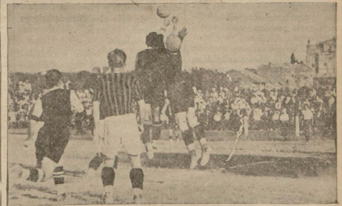
Dünkü maçta kaleci topu tutarken