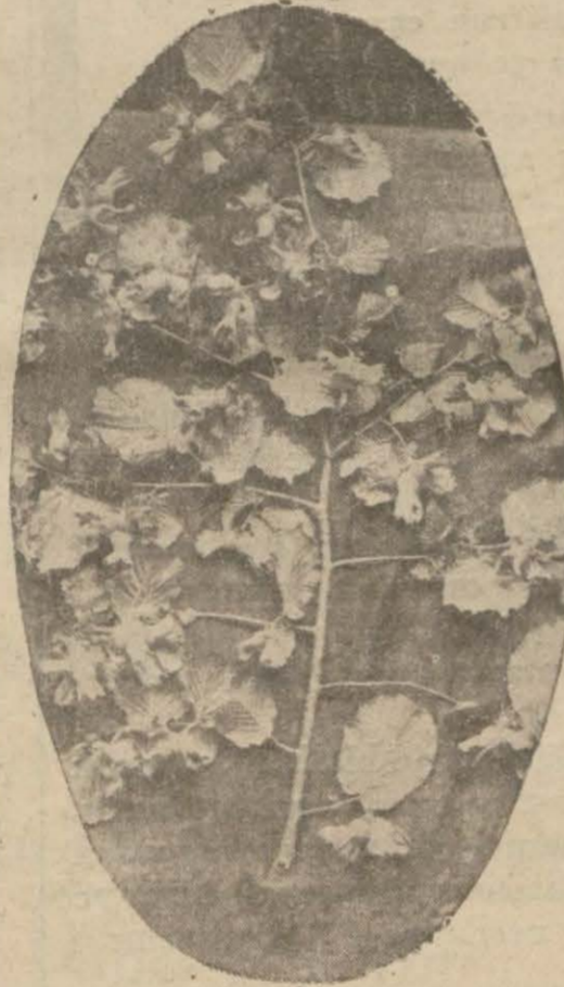
934 Mahsulü bir fındık dalı

Bundan on beş gün evvel fındık piyasası birden bire canlanmış, fiyatlar yükselerek fındık için kilosu 34 - 35 kuruşta 42 kuruşa kadar çıkmış ve hararetli satışlar yapılmıştır. Fakat bu canlılık devam etmemiş, bugünlerde piyasa gene durgun halini alarak fiyatlar 35 kuruşa kadar düşmüştür. Piyasamızın bu durgunluğundandır ki