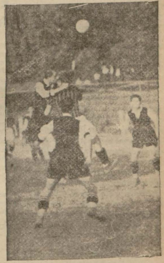
Maçtan bir intiba

Yavaş yavaş açılan Viyanalılar karşısında mütemadi gayretlerine rağmen hafif kalan Beşiktaşlılar bu gayretlerle kalelerinin etrafında dolaşan tehlikeleri biraz daha uzağa atmaktan başka fazla bir şey yapamıyorlardı.