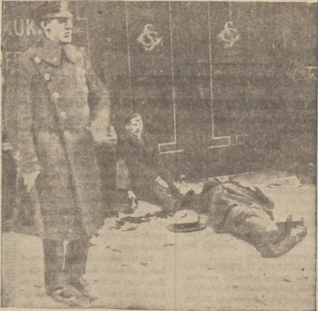
San Fransiscoda grevcilerle polis arasında yapılan bir müsademedin sonra yerde yatan mecruhlar . .

Grev yapanların adedi 150 bine balig olmaktadır, buna karşı grevi bozanlar cemiyeti 300 adam çıkarabilmiştir