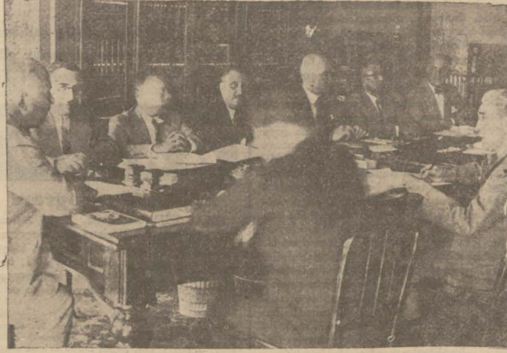
Fırka umumî idare hey etinin dünkü içtimasında