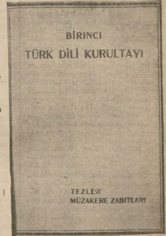
Maarif Vekâletinin neşrettiği kitabın kapağı

İhtilâl, fikir ve hamle fedakârlığı yapamaz. Ancak kan fedakârlığı yapar. İhtilâlcinin damarları, tükenmez bir harp mühimmatdır ki ne kadar bol har-