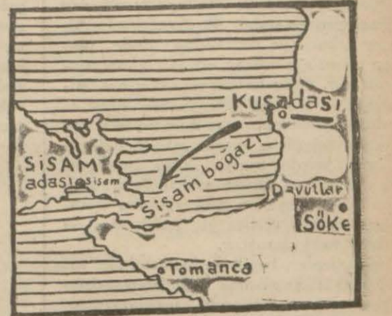
Cesedin arandığı Sisam boğazını gösterir harita

Asıl mesele bu müessif hâdisede etrafında iki tarafın etkârında yanlış rivayetlere meydan verilmemesi ve buntun acı bir hatıra bırakması ihtimalinin izalesi ve bertaraf edilmesidir.