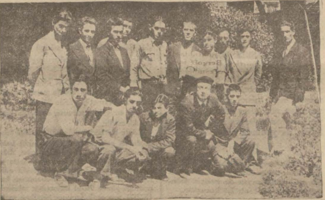
Kadırga Talebe Yurdu'nun kapanması münasebetile açıkta kalan talebe

Nüfusça bir şey olma nışsa da tramvaylar yarım saat kadar tamir yüzünden işliyememiş ir.