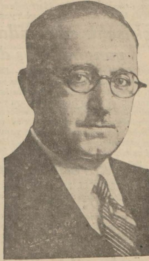
Iran hariciye Veziri Seyit Bakir Han Kazimi

Hariciye Veziri diyor ki: "İki dost millet arasındaki bu muhabbet ve meveddet Şark milletlerinin tarihinde ilebet paydar olacaktır"