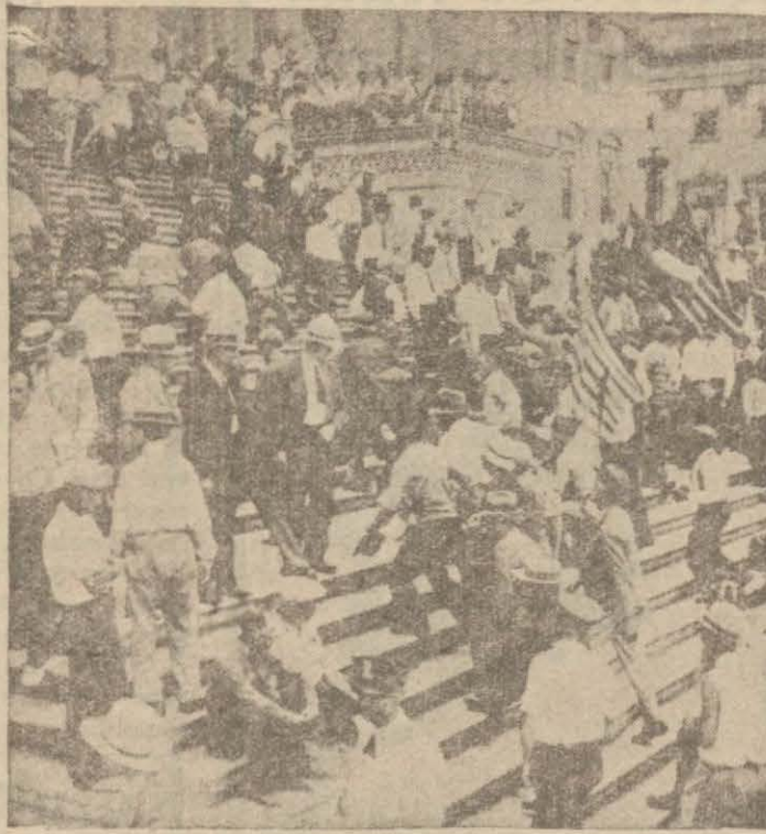
Son kargaşılığa tekkadüm eden günlerde bu hâdiselerin pişardığıym yapan bir amele nümayişi..

Grev komitesi reisi grev hareketine gösterdikleri alakadan bütün müstahdemine teşekkür eden bir