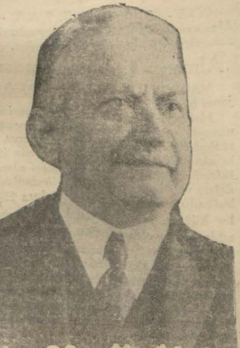
Yeni kabineyi teşkil edecek olan Reiscümhur M. Doumergue

PARIS, 7 (A.A.) — Müfrit sağ ce-nah unsurları dün akşam bilhassa Me-