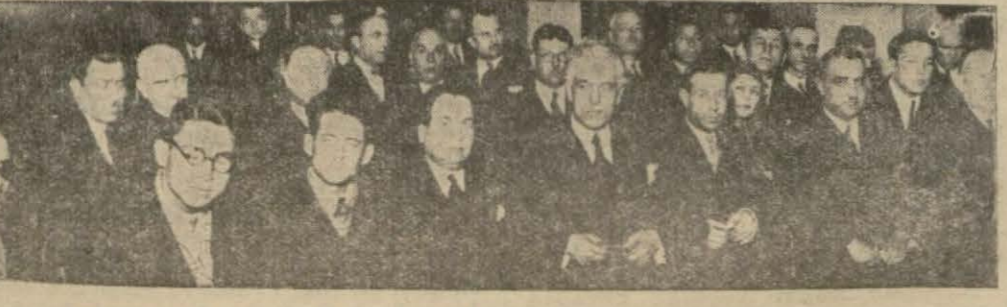
Halkevi İctimâi Yardım Şubesi dün kongresini yaptı. (Yazısı iç sayfamızda)

rar verdiği bildiriliyor. Ancak büyük devletlerin Avusturyayı bundan vazgeçmeğe çalıştıkları anlaşılmalıdır. Çünkü bu aralık Milletler Cemiyetinin vaziyeti bu derece nazik bir işin müteakkesine bile mühtemaldir. Avusturya şikâyetini Milletler Cemiyetine aktarırsa, Almanya ağılebi ihtimal, Cenevreye gitmeğe bile muvafakat etmeyecektir. Her halde Şarkta ve Garptaki iltihâfları şimdilik bertaraf etmeğe Al-