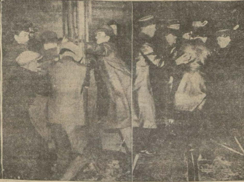
Bundan evvel yapılan nümayişlerden alınmış iki resim

(Stavisky hâdisesinden sonra Fransız efkârında şayanı dikkat bir tahavül husule geldiğine şahit oluyoruz. Bir haftadan beri hafiften başlayan tezahürler, evvelki gece büsbütün şiddet peyda etti. Ve maalesef kanlı bir netice verdi. Bu karışıklığın hakiki âmîli hakkında yerinde bir hüküm vermekte acele etmemek için bugün gelecek tafsilâta intizar etmek lâzımdır. Dün gazetemiz makineye verilinceye kadar Pariste cereyan eden hâdiseler hakkında aldığımız haberler şunlardır:)