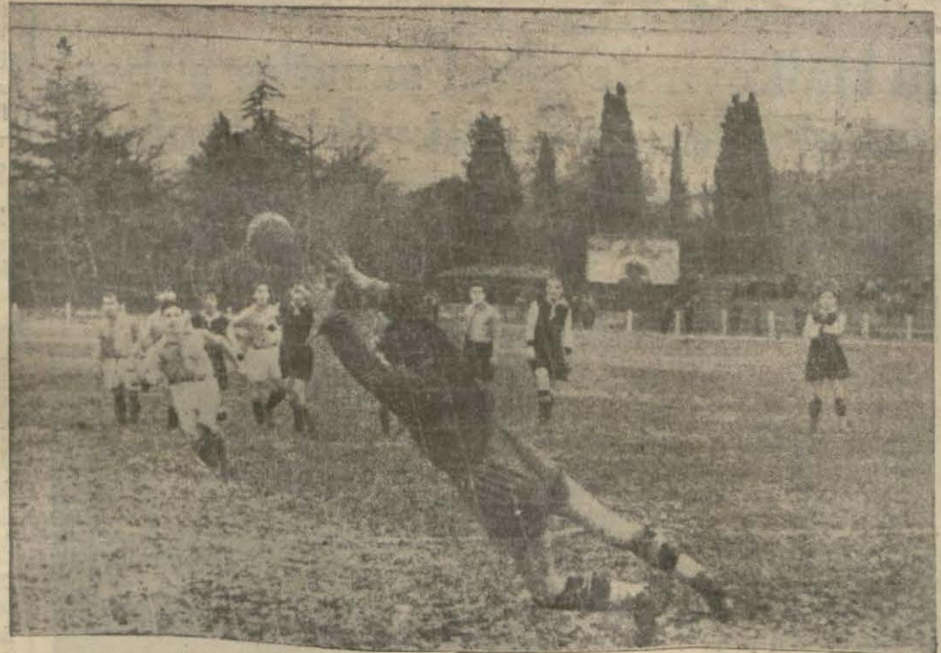
Beşiktaş ka lesine bir gol..

İlk devreyi mağlûp bitiren Beşiktaş, oyunu beraberlikle kurtardı