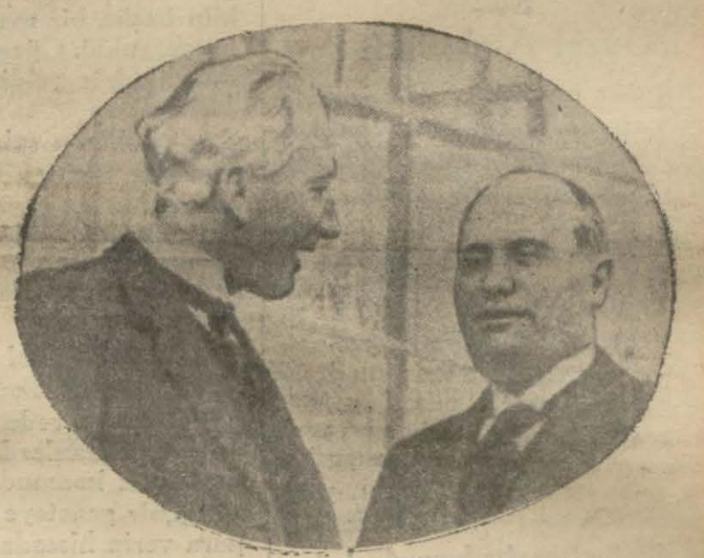
Sir John Simon ve M. Mussoli ni Romada son mülâkatlarında