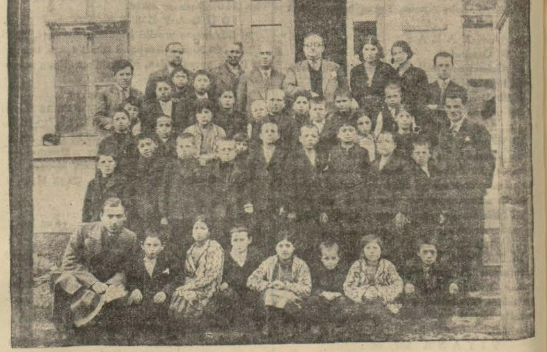
BOZUYUK, (Milliyet) — Kazada teşekkül eden Himayeitfal Cemiyeti iyi çalışıyor. 32 fakir çocuğa her gün ve muntazaman öğle yemeği verildiği gibi, bu çocuklar baştan aşağıya kadar da giydirildi. Kasaba Halkevinin ve Himayeitfal Cemiyetinin bu uğurdaki gayretleri sayanı takdirdir.

Diyerek, onu kaçırın bu meçhûl eli yakalamak istedi. Derhal atına binerek şehrin kapılarını do-