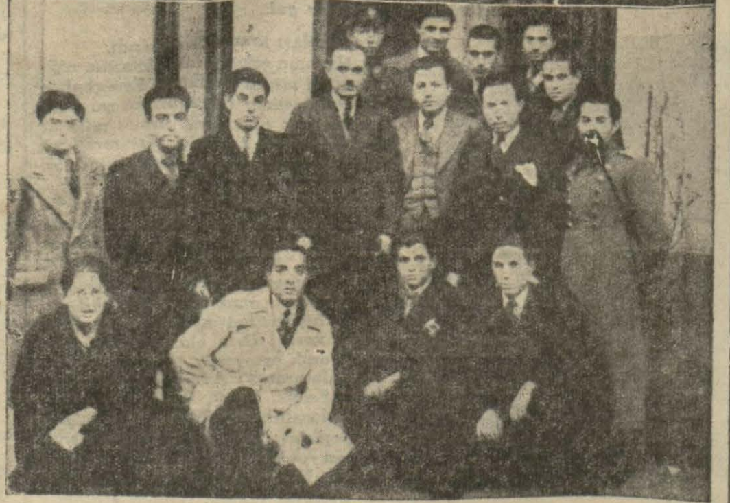
Yukarıda güzel sanatlar şubesi azası, aşağıda Toroslu gençler

Halkevi Güzel sanatlar şubesi kongresi dün saat 17 de Halkevi salonunda yapılmıştır.