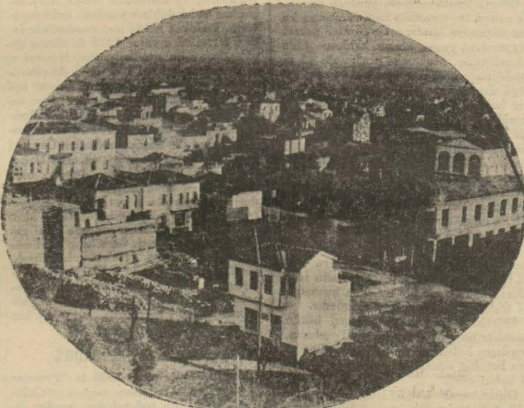
Nazilliye umumî bir bakış

NAZILLI (Milliyet) — Nazillimiz Aydın demiryolunun 176 ncı kilometresinde ovaya hakim hafif meyilli bir ertazi üzerindedir. Denizden yüksekliği 85, 7 metredir. Şimalindeki yeşil dalgalı tepeler şehrin manzarasını bir kat daha güzelleştirir. Tren hattı şehrin ortasından geçer bu suretle Nazilliyi ılıyeye ayırır. Büyük menderes nehri şehirden beş kilometre ileridedir. Nazilli ısgal zamanında hemen tamamile yanmıştır. Bugün harabe yerinde yeni bir şehir kurulmuştur. Muntazam cadde ve sokakları şık ve yeni binalarile Nazilli bu havalinin en güzel ve modern bir şehri olmuştur. Şehir gittikçe güzelleşmekte ve büyümektedir. Her gün yeni bir binanın temellerinin atıldığı ve çatılarının kurulduğu görülür. Başlıca istihlalât pamuk olan bu şirin kasabanın halkı çalışkandır. Kasabamızda on iki bin nüfus yaşamaktadır. Aynı zamanda nüfus adedi gittikçe yükseliyor.