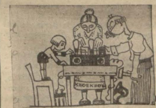
"Tamatir komisyonu" nun resmidir.

Amerika Hariciye nazırı Roper tarafından Amerikan radyosu hakkındaki noktâ nazarını bir rapora Cümhurreisi Roosevelt bildirmiştir. Haber verildiğine göre devlet monopollüna şiddetle taraftar olan Mr. Roosevelt bu hususta Amerikan konferansına bir lâyiha verecektir. Amerika radyosu istihbarat işleri yalnız bir elden idare edilecektir. Bundan başka harp zahurunda bütün radyoların Amerikan ordusuna hizmet etmeleri için de tedbir alınmıştır.