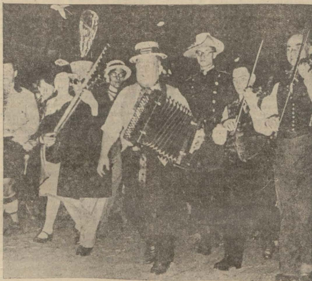
Bu hafta bütün radyo programlarını karnaval zamanına mahsus müzikli ile eğlenceli neşriyat ıgal etmekte idi. Resmimiz Almanyada bir karnaval balosunda Şrammel takımının doluşmasını gösteriyor.

Avusturyadaki son hadise esnasında halkın her dakika şuradan derek heyecana kapılmasına malik bırakılmamak için Viyana radyosu her gün sabah geç erken saatlerden gece neşriyatının sonuna hakkında halkı tenvir eden haberler neşretmektedir.