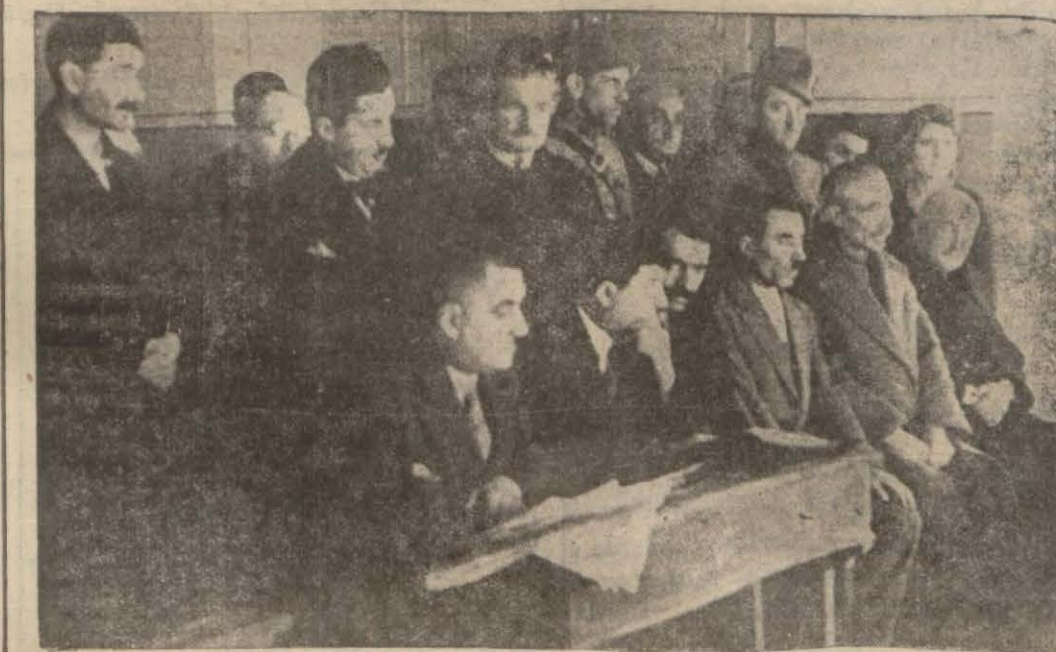
Adliye yangını davasından maznun olanlar huzuru hâkimde..

Ölümler dün kaldırıldı VIYANA, 20. A.A. — Viyanada ihtilâl esnasında vurulup ölen 50 müdafinin cenazesi bugün büyük merasimle kaldırılıyor. Bunlar arasında, biri binbaşî biri de yüzbaşî olmak üzere 25 zabta memuru 20 Heimwehren efradı, 5 de diğer teşekküller mensupları vardır. Bilumun gazeteler siyah çerçeve olarak intişar etmekte ve halkı huşua davet eden uzun makaleler neşretmektedir. Bunlar Avusturyanın gene bir uhuvvet ve hüsnü muşarret diyarı olarak kalacağı ümidini izhar ediyorlar. Bugünkü gün milli matem günü olarak ilân edilmiştir. Birçok mebanî yarım bayrak çekmişlerdir. Avusturya demir yollarında, beş dakikalık bir ihtiram faslası tatbik olunacaktır. Cenaze alayı, Viyana belediye daire-sinden, saat 13 te hareket edecektir. Alaya iki tabur piyade, bir batarya topçu bir müfrez dragon ve yarım müfrez suvari polis kütaları iştirak eyleyecek ve alaya başvekil muavini Fey kumanda edecektir. Reisisümler ile başvekil, belediye daire-sinde, sandukaların önünde birer hitabe irat edecektir. Üç devlet Avusturyayı müstakil görmeye çalışıyorlar VIYANA, 20. A.A. — Üç büyük devlet intişar etmekte ve halkı huşua da-