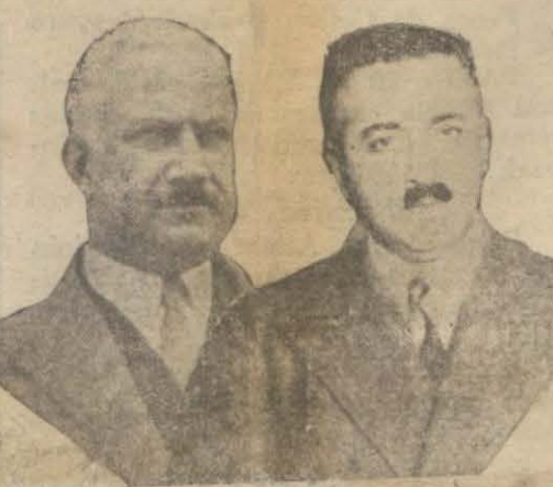
Recep ve Hikmet Beyler

Recep ve Hikmet Beyler bu günlerde geliyorlar Maarif vekili Hikmet Beyin önümüzdeki salı günü Ankaradan şehrimize gelmesi beklenmektedir. Vekil birlikte firka umumî kâtibi Recep B. ve Maarif vekâleti umumî müdürleri, müfettişler de şehrimize gelecektir. Hikmet Bey burada, bir marita tedrisata başlayacak olan İnkılâp enstitüsünün resmi küşadını yapacaktır. Enstitüye ait bütün hazırlıklar tesbit edilmiştir.