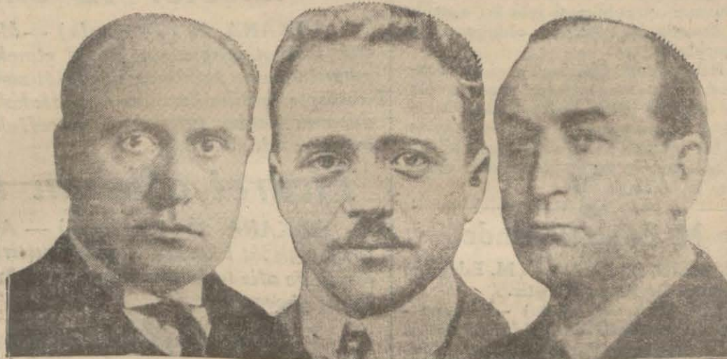
M. Mussilini M. Dollfuss M. Gombos