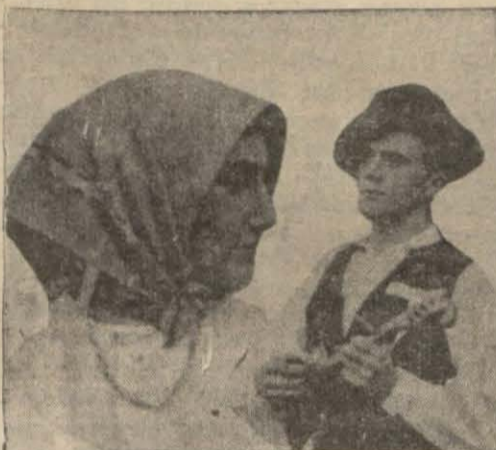
Belgratta 23-2-934 akşamı saat 21 de unumü Avrupa konserinde şarkılarını dinleyeceğimiz iki Petrovinalı Sırp köylüsü milli kıyafetlerle

Cuma akşamı (23-2-934) saat 21 de Yugoslavyada verilecek bir konser bütün Avrupa merkezleri tarafından naklen neşredilecektir. Bu konser karakteristik bir Sırp müzikisini ihtiva edecektir. Konser Sırbistanın muhtelif mahallerinden nakledilecektir. Jübiyanadan talebenin iştirakile halk şarkıları, Zagrepten de bizzat köylülerin bugün söylemekte oldukları popüler şarkıları bizzat Petrovina kasabası köylülerinin ağzından ışıteceğiz.