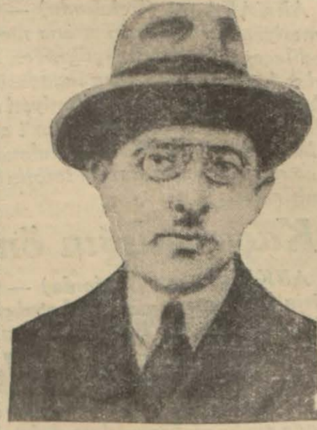
Maliye Vekili Fuat Bey

Bütçe 180 milyona çıkarılacak mı? Varidatın yükseltilmesi için bulunacak tedbirler henüz tamamen kararlaştırılmamıştır