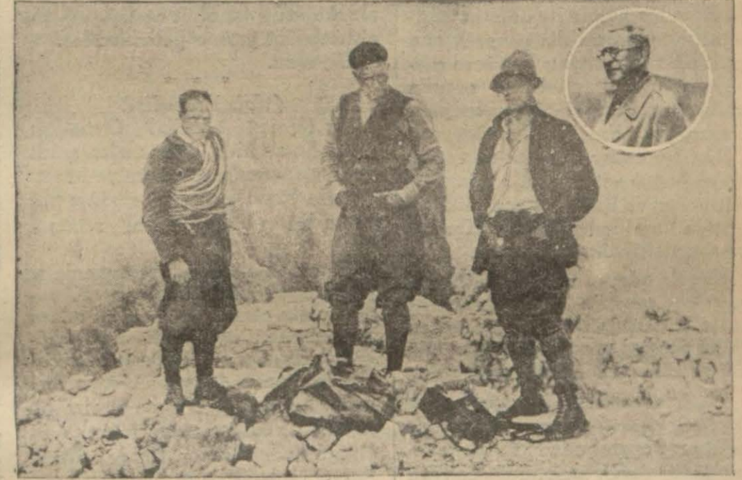
Müteveffa Belçika Kralı Hazretleri en çok sevdiği ve yoluna kurban gittiği dağ sporunu yaparken: 1929 da alınmış bir resmi. (Madalyon içinde müteveffa kral askeri üniforması ile)