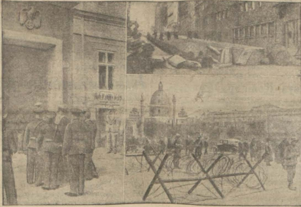
Avusturyadaki ihtilâlin Viyana sokaklarında bıraktığı ölümlerden, tel örgü ve müdafaa tertiplerinden intibalar..

Dairelerin yeni masraf bütçe projelerini yekünü masraf bütçemizin artmasını icap ettirmektedir. (170) milyon lira olan 1933 varidat bütçesi hazırlama kadar bir miktar açık vereceği manzaranın arzettiğinden önümüzdeki mali sene varidatı arttırmak için bazı tedbirler almak zarureti hasıl olmaktadır. Hazırlama kadar olan devre için de bazı tasarruf tedbirleri alınacaktır. Bu tedbirlerin nevi ve mahiyeti hakkında henüz verilmiş bir karar yoktur. İcra Vekilleri Heyetinin önümüzdeki içtimalarında cereyan edecek müzakereler ve verilecek kararlara intizar etmek lazımdır.