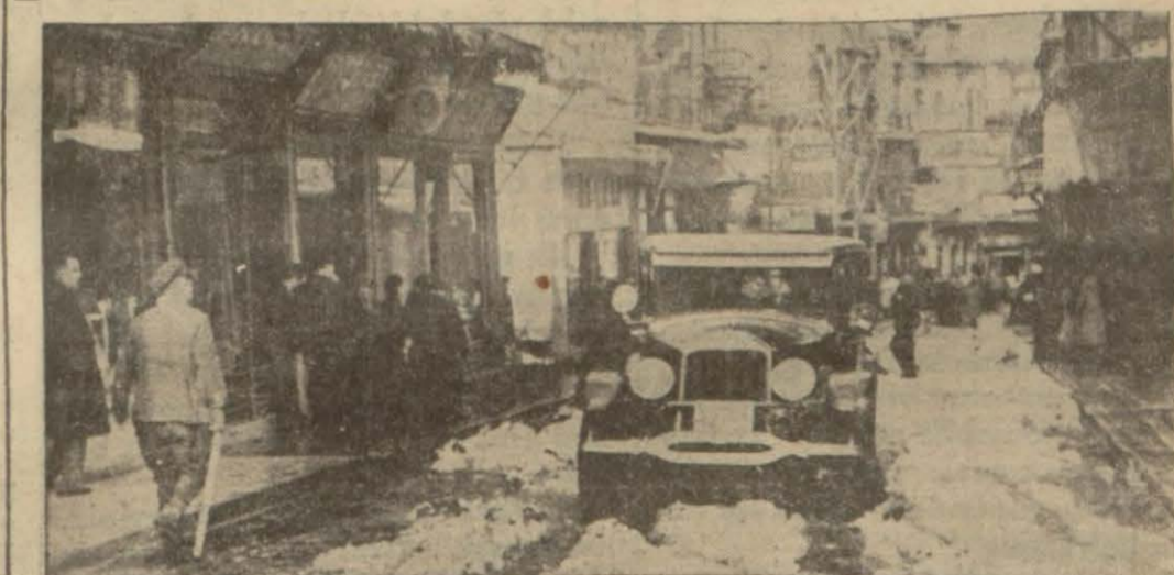
İstanbulun büyük caddelerinin üç dört günlük hümmalt temizliğe rağmen arzettiği vaziyet gene bu resimdekinden ileriye geçemedi..