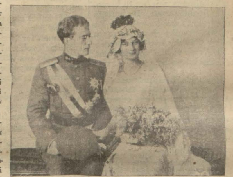
Yeni kral ve kraliçe ilân edilecek olan veliâht Prenses Leopold ve Prenses Brabant

Belçika kralı Albert Hz. dün feci bir kaza ve tesadüfün kurbanı oldu. Şahsiyeti, hizmeti ve Belçika tarihindeki büyük rolü ile milletin perestisi derecesine varan sevgisini kazanan kralın feci ölümü memleketinde olduğu kadar, haric ve dost memleketlerde de büyük bir teessür uyandırmıştır. Askerliği, siyasi zekâsı, ve memleket idaresindeki yüksek kabiliyeti ve hayırhahlığı ile tanınan ve bu nisbette