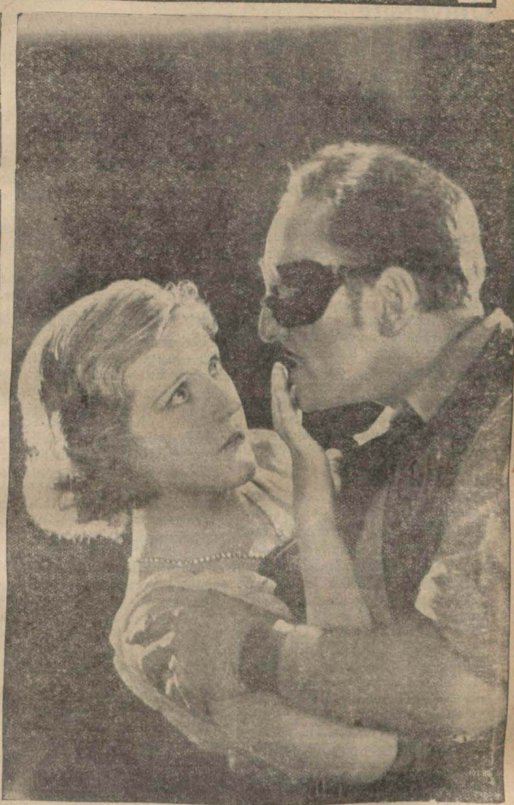
(Dağlar Kızı) filminden bir parça..

Bu sanatkar sesinin güzelliği ile bütün dünyaca tanınmıştır.