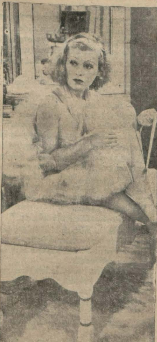
Sarışın Kukla filminde Lilian Harvey

Filmin mevzuu bir haydut çetesi reisinin bir valinin kızile sevmesi ve o sebeple hükümet kuvvetleriyle çarpışmasıdır. Film enteresandır.