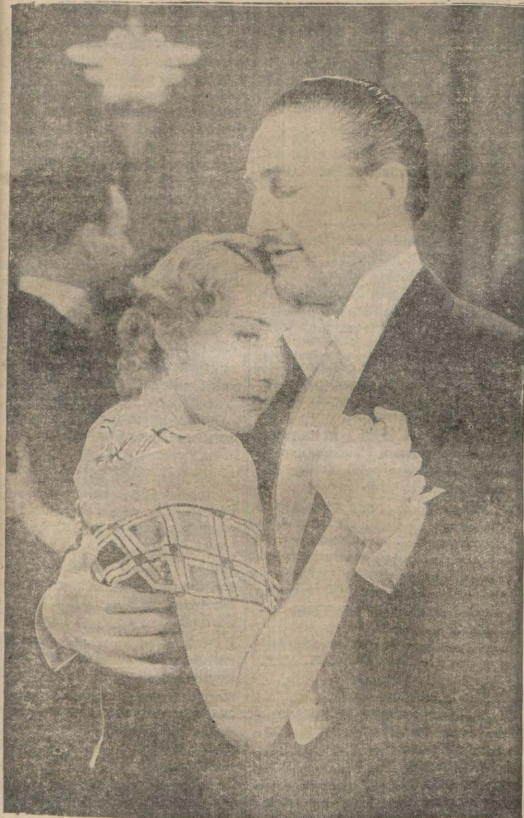
(Altın arayan kızlar) filminden