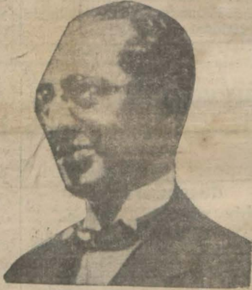
Tevfik Rüştü Bey