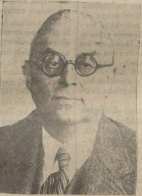
İktisat Vekili Celâl Bey

ANKARA, 27 (Milliyet) — İktisat vekili Mah- mut Celâl Bey bu- günkü trenle İs- tanbula hareket et- miştir. İstanbul da vekâlete mer- but bazı mühim iş- lerin mahallen tet- kikatine meşgul ol- acakları ve bu me- yanda Sümer ban- ka ait mevcut ve tesis olunacak fab- rikalar ve tahli- ye idaresi teşkilâ- tının daha modern hale getirilmesi meseleleriyle uğra- şacakları anlaşıl- maktadır. İktisat vekâleti hüt-