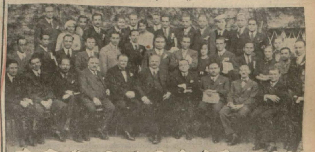
Türk talebesi Viyanalı prof esörlere ve talebeler arasında

ya da uğramış ve Elçiliğimizin de- lâletile, asri laboratuvarları tesisi- satı ve bilhassa kütüphanesi ile tanınmış olan Viyana Dünya Ti- cari Ali Mektebini ziyaret etmiş- (Devamı 6 ncı sahifede)