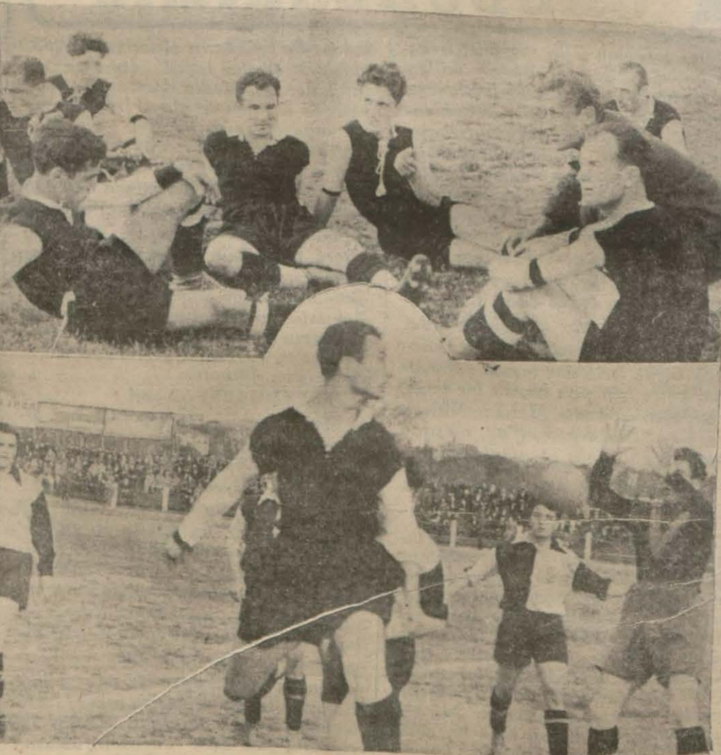
Dünkü maça dair iki intiba (Yazısı iç sahifemizde)