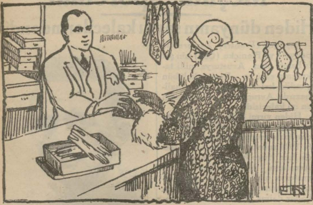
Eldivenler, ipeklî çoraplar, kostümlükler alır, akşama soğan ekmeğe yerlerdi.