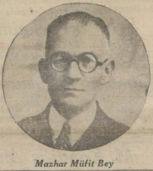
Mazhar Müfit Bey

Ankara'da bulunan vali ve belediye reisi Muhittin Beyin ne günü şehrimize, döneceği malûm değildir. Esnaf bankası meselesi hak (Devamı 6 ncı sahifede)