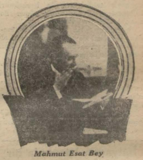
Mahmut Esat Bey