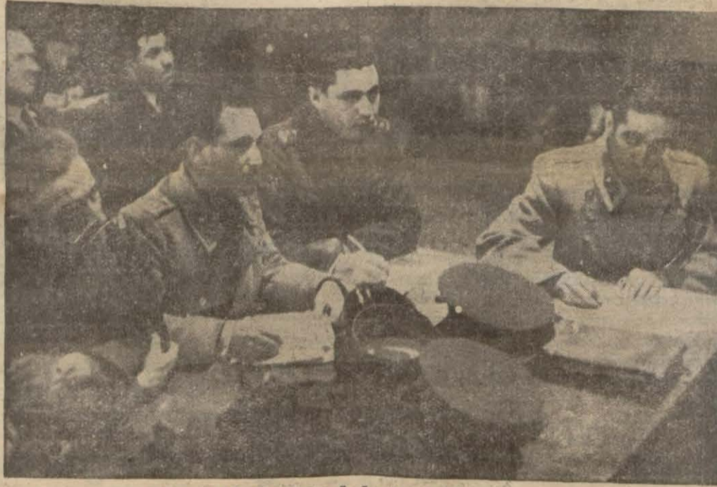
Harp Akademisi talebesi not alıyor.

dünkü dersinde aldığımız notları aşağıya yazıyoruz: Türk inkılâbının ifadesi "Arkadaşlar, Yirminci asrın başlangıcında iken Türk ufuklarında bir hâdise oldu. Dün ya tarihi bu hâdiseyi Türk inkılâbı diye kaydetti. Türk inkılâbı birbiri ardından gelen vakalar değil, her biri ölümlüğüni tamamlayan büyük vakaların ifadesidir. Bu topraklarda yaşayan bu asil millet, en şeni idareler altında kendi siyasi benliğini, içtimai varlığını kaybetmiş görünür bir hale gelmişti. İnkılâp, fenayı, köhneyi, zararlıyı bir