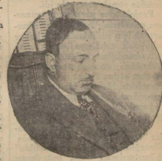
Burhan Cahit Bey

Burhan Cahit Bey masasının başında idi. Muhakkak ki roman yazıyordu ve gene muhakkak ki romanın en tatlı yerine gelmişti. Bir saniye için kalemi elinden bırakırmaz, atıldım: — Anketime ilk cevabı sizden istiyorum! Başını kaldırdı: — Hangi anket bu? — İlk tahsil çağındaki çocuklarımızı. Sözümlü bitirmeden mevzuu anladım: — İyi tesadüf.. Ben de şimdi İsmet Paşanın nutkundan bazı notlar okuyordum. Sor bakalım.. — Sorayım: İlk tahsil çağındaki çocukların acıklı vaziyeti hakkında ne düşünüyorsunuz? Bunların pek çoğu, tahsillerini neden yarıda bırakıyorlar? Burhan Cahit Bey, düşündüklerini (Devamı 5 inci sahifede)