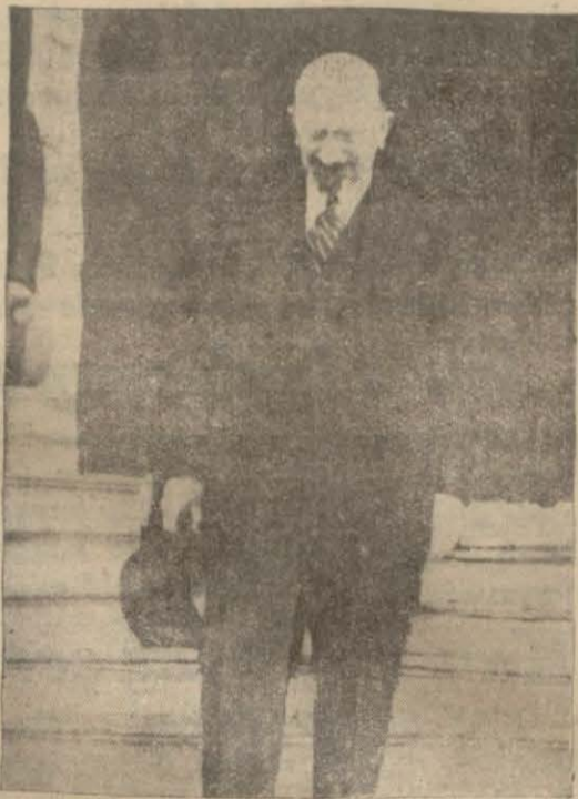
Dün misak etrafındaki itilâf üzerinde beyanatta bulunan Yunan Hariciye Nazırı M. Maximos

Misakın çarşamba günü Yunan Meclisinde tasdik edilmesi muhtemel Yunan kabinesi tefsiri beyanatın metnini kabul etmiştir