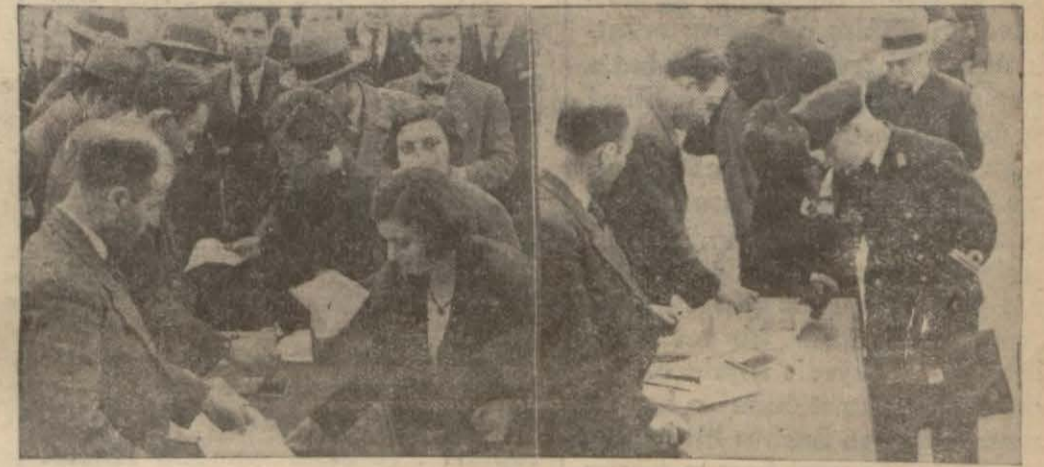
Yüksek mektep talebesi derse girmek için vesikalarnı kontrol ettiriyorlar..

Bugün: Beşinci sahifemizde Mm. Staviskinin tahkikat komisyonundaki ifadelerini Okuyunuz!