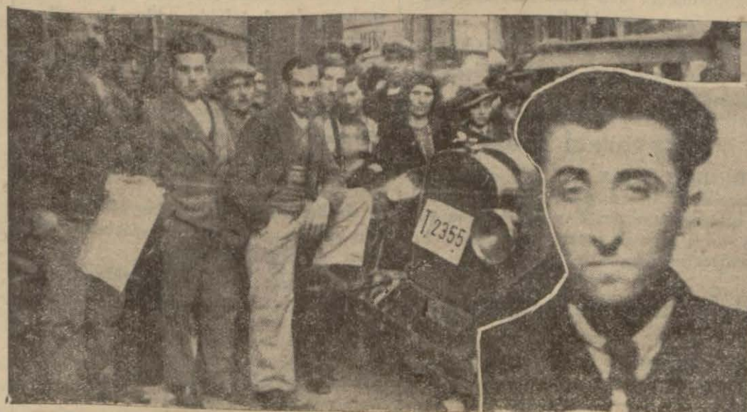
Dün Şişhane yokusunda bir şoför bir kadının bacaklarını kırdı, iki hadını yara vadi, bu yetişmişiyormuş gibi bir de ekmeği dükkânına girdi (Yazısı 3 ncü sahifemizde)