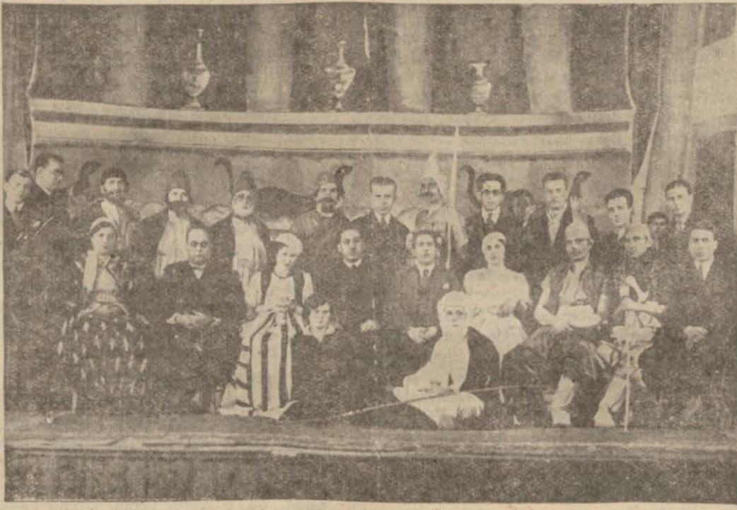
Temsil şubesi mensupların dan bazıları bir arada.

BURSA, (Milliyet) — Halkevinin üçüncü yılma başını münasebetle Bursa Halkevi heyecanlı tezahürlerini telgraf havadisleri olarak bildirirken bir arada bol bol alkış toplayan muallimlerin temsil ettiği çoban piyesindeki muvaffakiyetlerini de ilâve etmiştir.