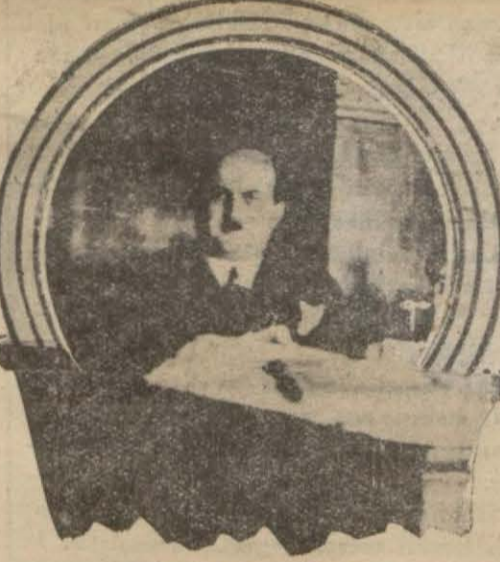
Vali Muhittin Bey

Bununla beraber bugüne kadar bu muhadden miktarları 1,490,000 lira kadar açık vardır. Bunun mukabil olan hizmetler yapılamamakta ve mas-