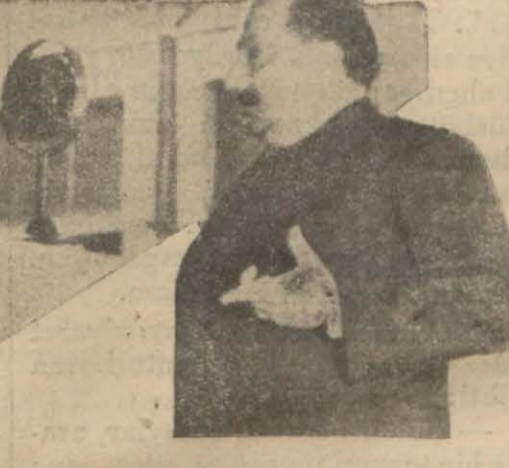
Mahmut Esat Bey dersini veriyor

Mahmut Esat Bey dün akşam da İnkılâp tarihi enstitüsünde derslerine devam etti. Mahmut Esat Beyin dünki dersleri bir buçuk saate yakın sürdü. Mahmut Esat Beyin dünki dersinde ihtilâllerin felsefesini ve hukukî mahiyetini izah ve ikmal etti. Aynı 18 in de doğrudan doğruya büyük Türk inkılâbına girecek ve inkılâbımızın adli, hukukî cephesini anlatmağa başlayacak - tir. Dünkü ders te çok kalabalık bir dinleyici huzurunda verildi. İçeride izdimah olmak için, dün salon kapılarında daha esast tedbirler alınmıştı. Milikdarı kâfi polis ve askerî izibat memurları ikame edilmişti. Üni-