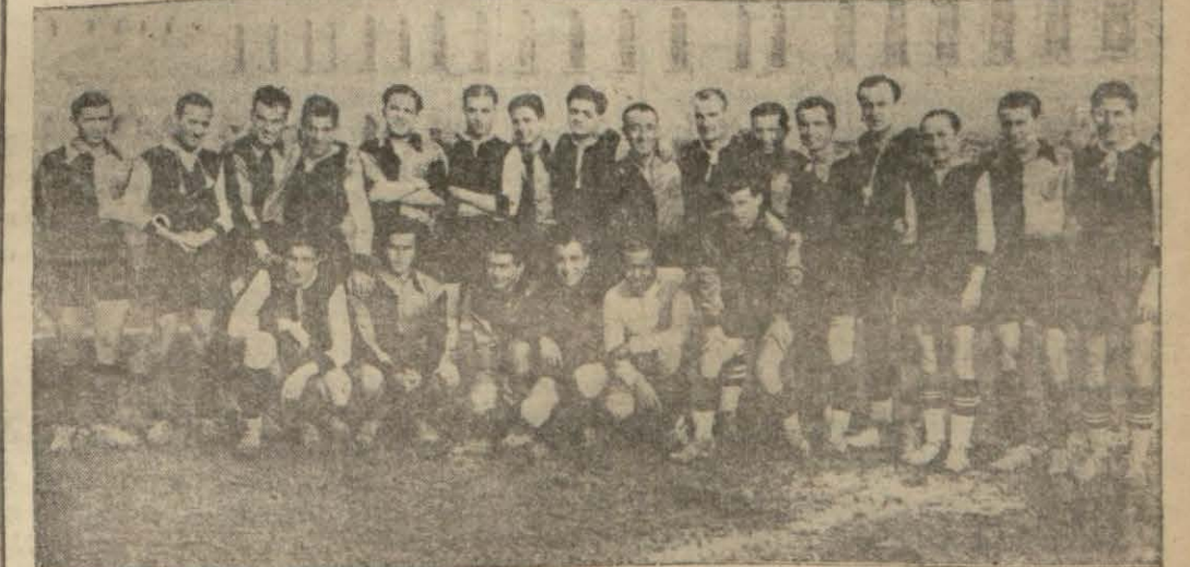
Beşiktaş - İstanbul spor bir arada.

Dün Taksim stadında birinci küme ilk maçlarından yalnız bir tanesi yapıldı.