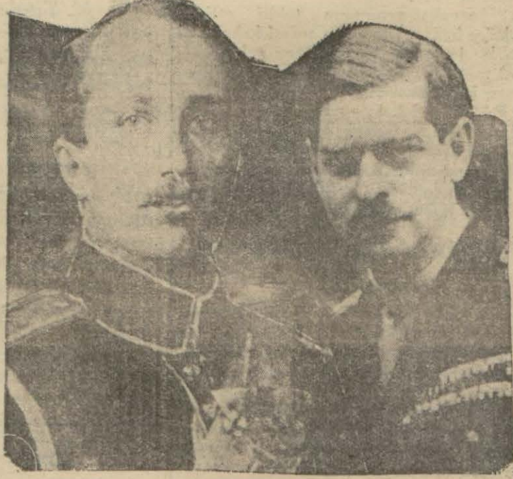
Bulgar Kralı Boris ve Romanya Kralı Carol

Yarın siyasî müzakereler ve mülla katlar olacaktır. Bunu müteakip hükümdarlar şerefine tertip edilecek bir av gezintisine gidilmesi muhtemeldir. Ava Kraliçe Joanna ve eski Yu-