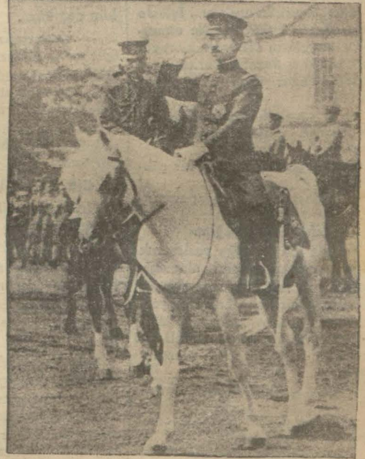
Japon imparatoru Hirohito bir harp kıtasının geçit resminde

ponya uzun vadeli bir siyaset tatbik ediyor. Bu siyaset tedbirleri ve sabırlı davranışları icap ettirir. Aynı zamanda Japonya Mançurya elde ettiği zeticeleri de kuvvetlendirmeye çalışıyor. Bununla beraber