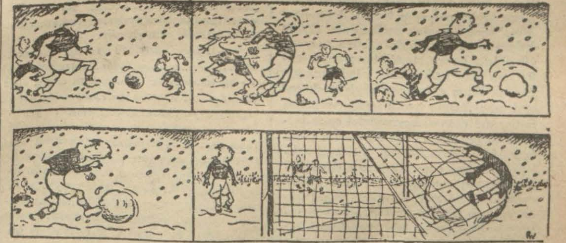
Karda futbol maçı ve gol

kümeyle terfi etti. 1925 birinci kümeyle terfi 1925 - 1926 birinci küme ikincisi 1926 - 1927 İngiltere kupası finalisti. 1929 - 1930 İngiltere kupası galibi. 1930 - 1931 birinci küme şampiyonu. 1931 - 1932 birinci küme ikincisi ve kupa finalisti. 1932 - 1933 birinci küme şampiyonu. Arsenal bu sene de birinci kümenin şimdilik başında bulunmaktadır.