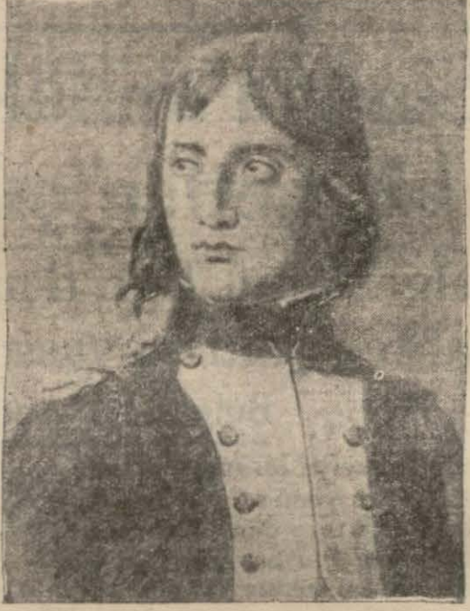
Bonapartın portresi (Versailles Müzesi)