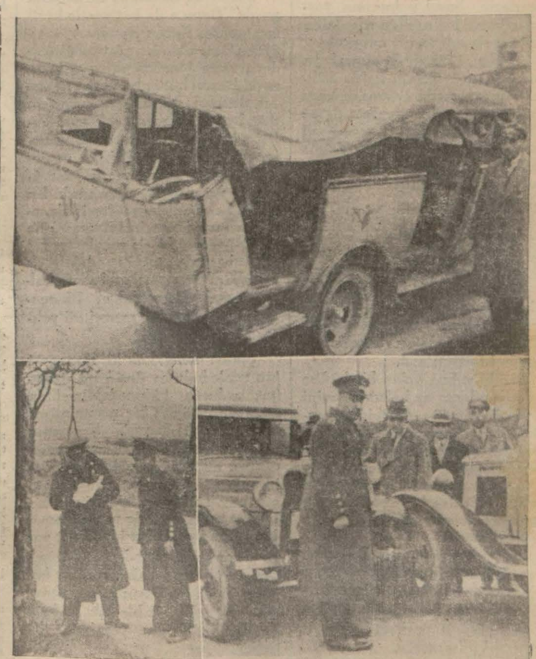
Yukarıda arka tarafı parçalanmış otobüs, aşağıda kaza mahallinde yapılan keşif ve otobüsün çarptığı ağaç ve yer..

Küçük kutular 60, büyükler 70 paraya satılacak ANKARA, 20. A.A. — Kibrit fiyatları hakkında müzakere etmek üzere Ankaraya gelen kibrit şirketi müdür ve müessilleri dönmüşlerdir. Maliye vekâleti üzerinden fiyatları hesap ederek mukaveleyle istinaden küçük kutuların altmış ve büyük kutuların da yetmiş paraya satılmasını şirkete tebliğ etmiştir.