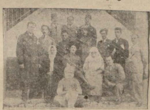
Kırkağaç gençleri temsil kolu

KIRKAĞAÇ, (Milliyet) — Burada C.H.F.sının himayesinde (Gençlerbirliği) teşekkül etti. Birliğin nizamnamesini gördüm, teşekküldeki maksat ve gaye çok güzel ve iyi.