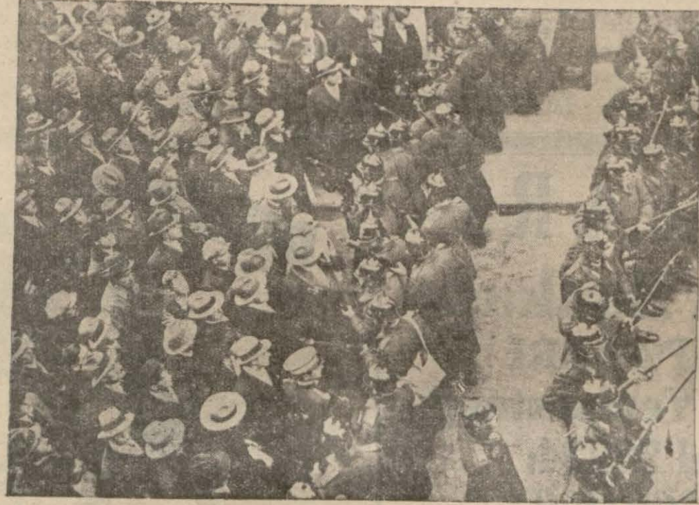
Bükreş polisi Demir muhafız azasının bir nümayişini dağıtırken

Yüzde yüz yahudi aleyhtarlığı güden bu fırka sekiz sene evvel nasıl kuruldu?