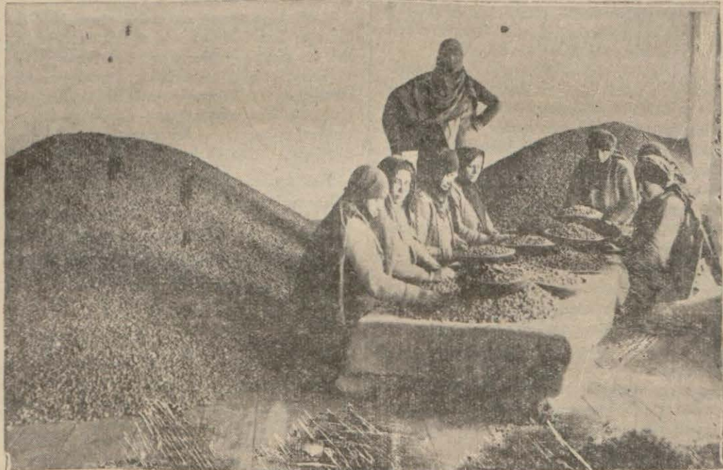
Bir fabrikada fındık içi seçen amele..

Geçen sene 1,391,259 lira değerinde 3 milyon küsur kilo fındık çıkarıldı