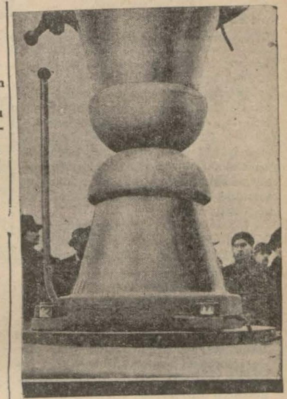
Budapeşte radyo merkezini 314 metre boyundaki anten kulesini üzerinde taşıyan porsilen izolâtör

20 den 21 re, 22 den 1 re kadar 49,50 metrelik Philadelphia (Amerika) merkezi hergün sabaha karşı saat 3 ten 8 ze kadar 49,59 metrelik Daventri (İngl.) merkezi her gece saat 1 den 3 ge kadar ve Pazartesi ile cumartesi de 21 den 21,15 ze kadar, 50,26 metrelik Vatikan (Papalık) merkezi cumartesi, pazar ve pazartesi saat 12 den 12,30 za kadar program neşretmektedirler.