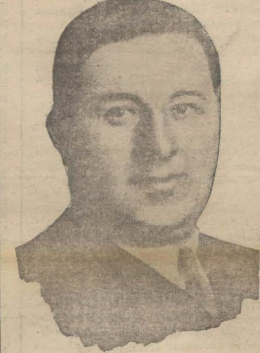
Ziraat Vekili Muhlis Bey

Celâl B. de sun'î ipek, kimya sanayii ve diğer kısımlar hakkında mütemmim beyanatta bulundu. Program Türk-Yunan iktisadiyatı için inkişaf merhalesi oluyor