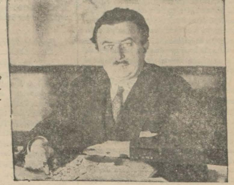
Dün bütün vilâyetlere seçim hakkında tebligat yapan iç işler bakanı Bay Şükrü Kaya

Çünkü belediye intihabatına da kadımlar iştirak etmiş ve belediye azalığı da esasen kadımlara verilmiş bulunmaktadır. Ancak yaş meselesi noktaları üz-