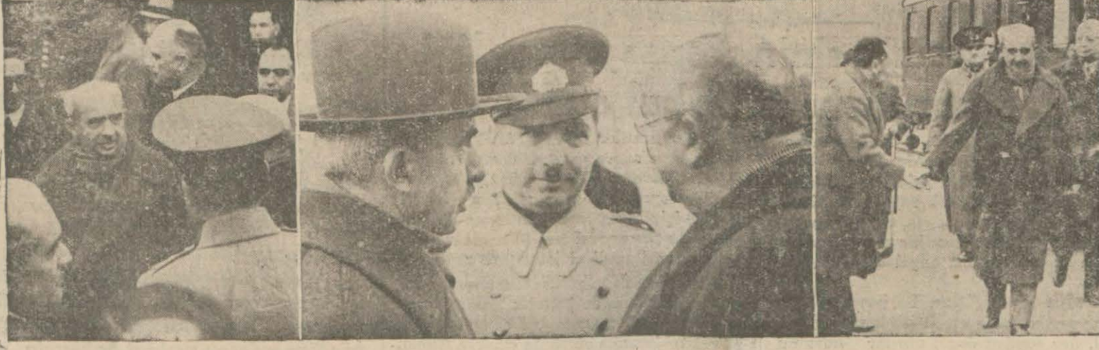
Başbakan General İsmet İnönü Haydarpaşada karşılanıyor