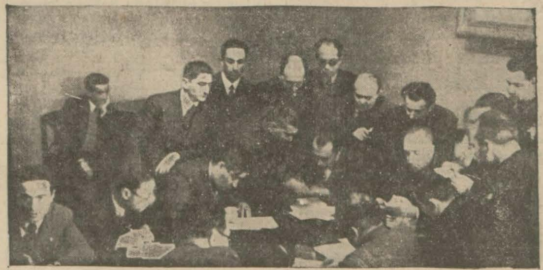
Basın Kurumu kurultayında reylerin tasnif edildiği bir köşede