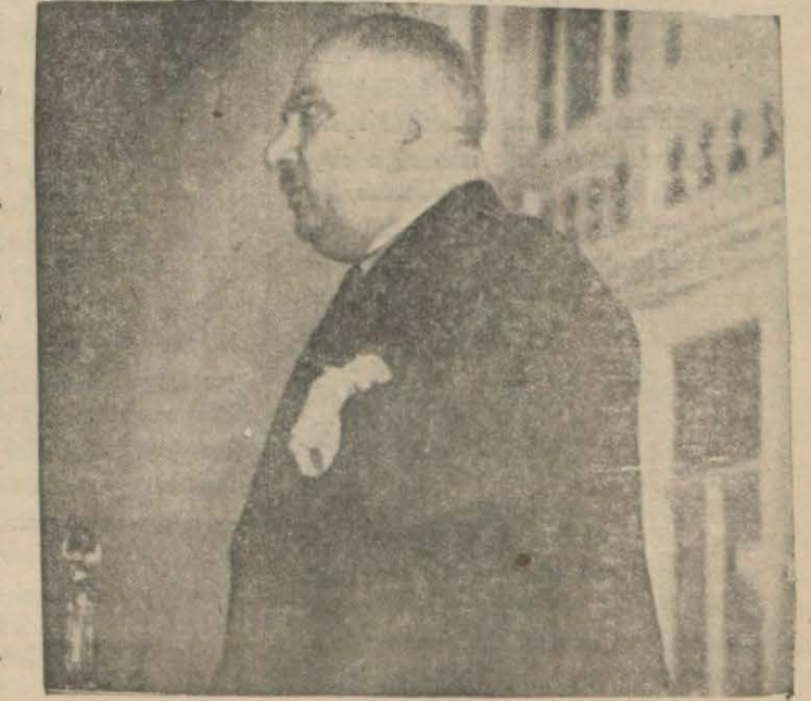
Bay Recep (Kütahya) dün ilk dersini verirken büyük evrensel hâdiseleri Türk inkilâbını gözden geçireceğiz. Arılık - temizlik sağlık, baylık (Devamı 5 inci sahifede)

"Arkadaşlar, "Yer yüzünün arılık ve baylık bakımından üstün bir ulusu olan Türkleri yüksek bir hızla yokluktan varlığa, düşkünlükten onöre götüren