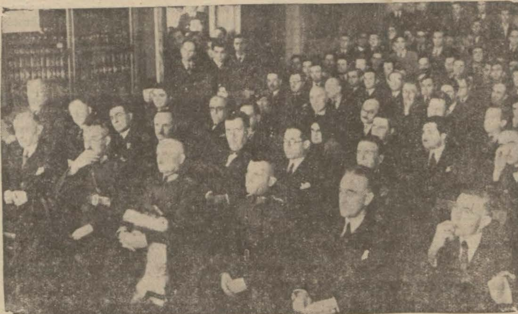
58 inci yılı kutlulayan Mülkiyeliler bir arada..

ROMA, 4.A.A. — Dünkü uzlaşma mü- cibince, Sar havzasındaki reyiâm, Al- manyanın lehine neticelendiği takdirde, bu devlet, Sar madenlerine ve daha baş- ka borçlara karşılık olarak 900 milyon (Devamı 6 inci sahifede)