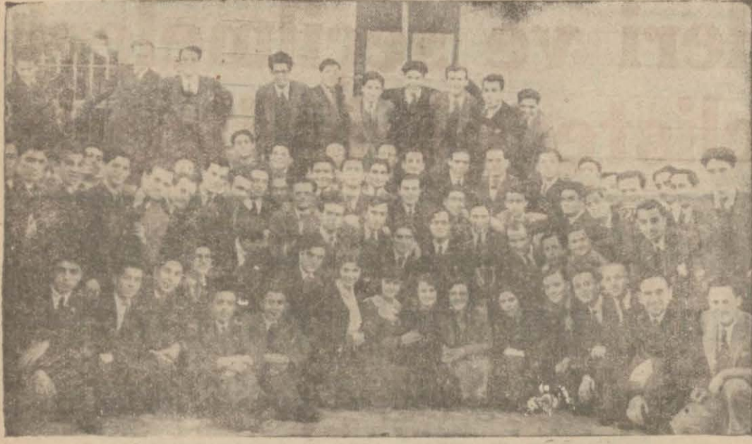
Mülkiye mektebinde okuyan gençlerimiz bir arada...