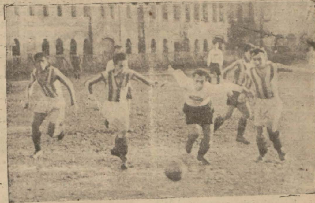
Dünkü maçtan bir enstantane

Ateş - Güneş kongresi Atatürk'ün klube verdiği "Güneş", ismini alkışla karşıladı Güneş takımı Vefayı 5-1 yendi