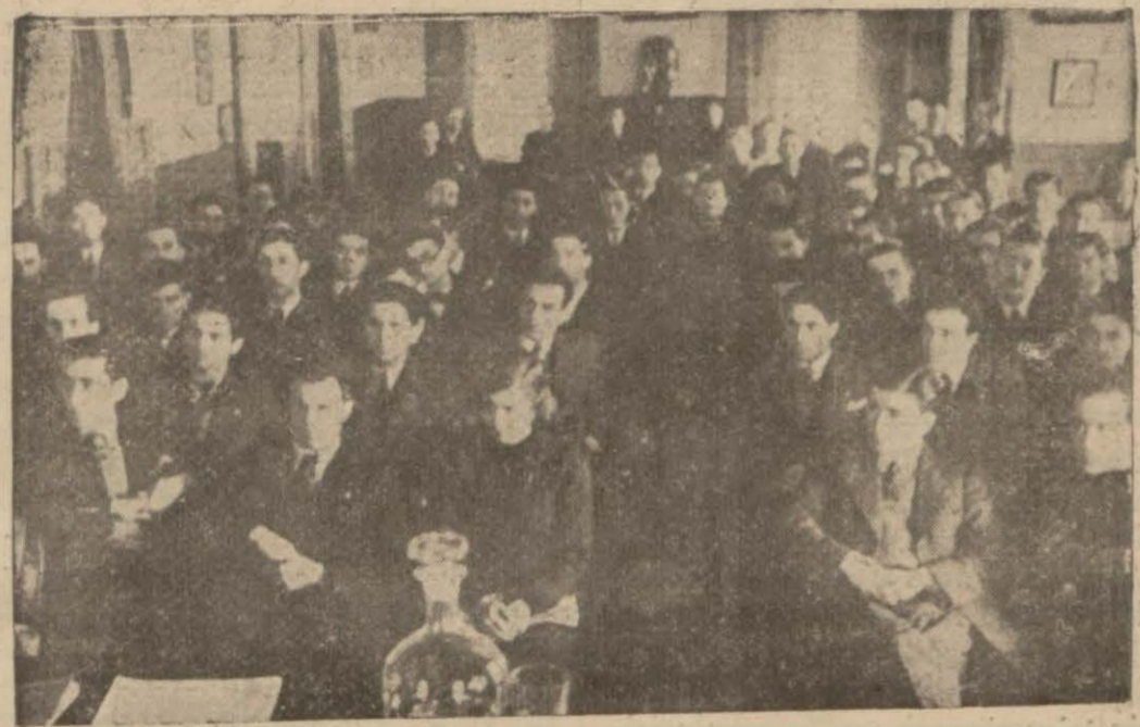
Birliğin toplantısına iştirak edenler

T. birliğinin bir yılda yaptığı işler, şehitler âbidesi ianesi Kubilây ihtifalına iştirak mes'e leleri gürüşüldü