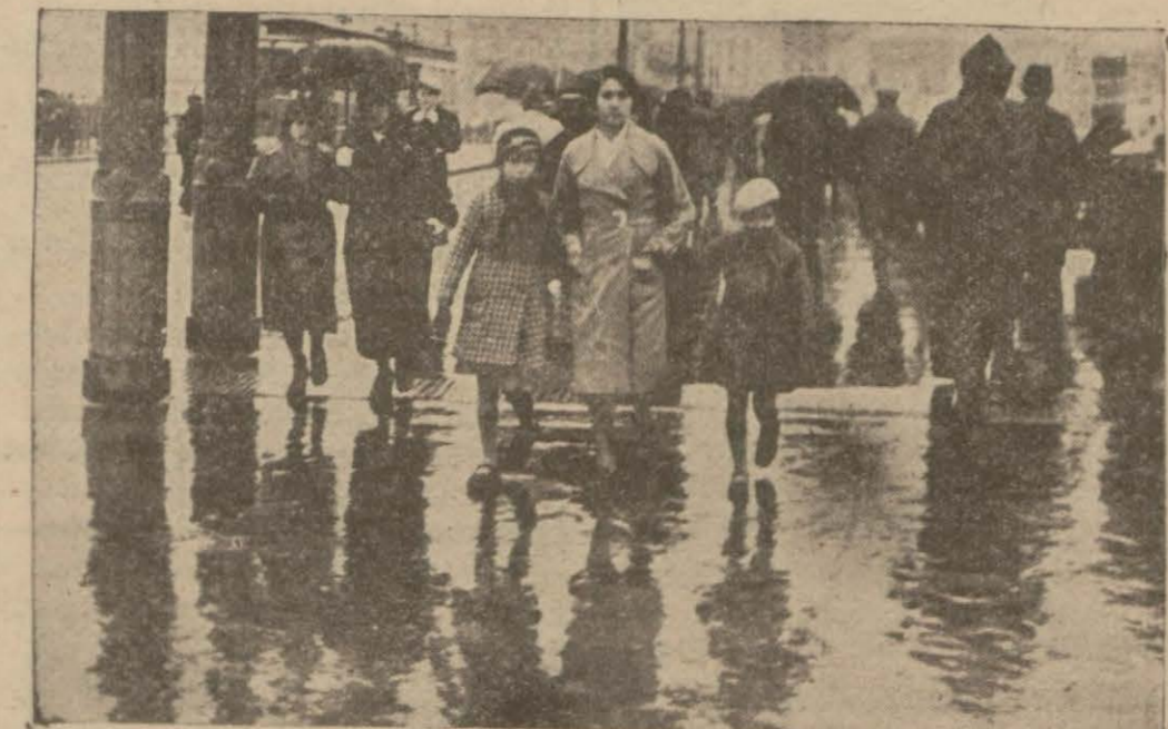
İstanbul'un yağışlı manzarası

Dün sabah şehrimize dolu yağdı Amerikada ise soğuktan ölenle var