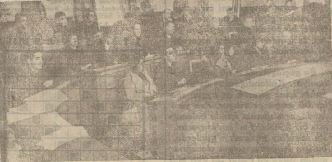
Seyyah tercümanları için belediye bir kurs açtı. Dün kendilerine ilk ders verildi. Resminiz ilk dersten bir intibadır.