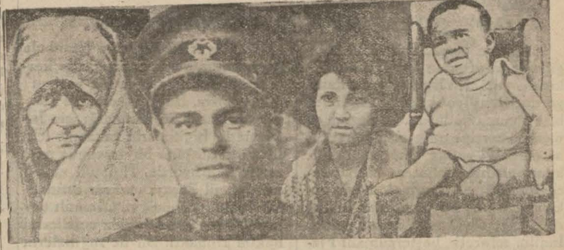
TÜRK İNKILABININ ZAFERİ İÇİN DURMADAN, DÜŞÜNMEDEN, CANINI VE KANINI VEREN AZİZ ŞEHİT KUBILAY, GERİDE BIRAKTIĞI ANNESİ, KARISI YAVRUSU...