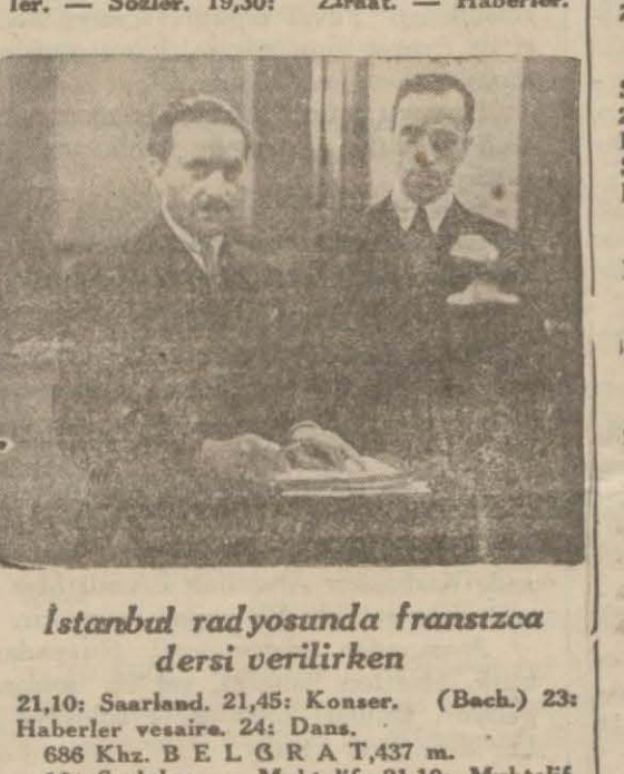
İstanbul radyosunda Fransızca

223 Khz. V A R Ş O V A, 1345 m. 16:45: Hafif musiki. 17:45: Sözl. 18: Nakil.